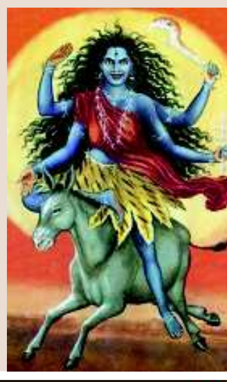
સ્વરૂપ પૂજાશે. માં આદ્યશક્તિના સાતમા સ્વરૂપની પૂજાનું વિશેષ મહત્વ હોવાના સંજોગો આધિન વધારે બન્યું છે. જેમાં માં ભગવતીએ કાળરાત્રીનું સ્વરૂપ ધારણ કર્યું છે. જેમાં માં કાળરાત્રીનો વર્ણ કાળજળ જેવો કાળો છે તેથી તેમનું સ્વરૂપ ભ્યાનક છે, માતાજીની ત્રણ મોટી મોટી આંખો છે જેમાંથી અગનવર્ષા થાય છે. અને જેનાથી માતાજી પોતાના ભક્તો ઉપર અનુકંપાની દ્રષ્ટિ રાખે છે. તેમજ

દાનવ, દૈત્ય, રાક્ષસ, ભૂત-પ્રેત આદિ મા કાળરાત્રીના સ્મરણ માત્રથી ભાગી જાય છે ગાંધીનગર, તા. ૩૦ ભગવતીની આરાધનાના પર્વ નવરાત્રી તેની ચરમસીમાએ પહોંચી ગઈ છે. શ્રદ્ધાળુઓ પોતાની શક્તિ પ્રમાણે ભક્તિ કરી રહ્યા છે. તો ખેલૈયાઓ પણ આ નવરાત્રીના ઓરતા અધુરા ન રહે તે રીતે ગરબે ધુમી રહ્યા છે. માતાજીના છ સ્વરૂપોના પૂજન અર્ચન થકી ભક્તોએ માં ની અપારકૃપા મેળવવાના પ્રયાસો કર્યા છે. જેમાં આજે સાતમા દિવસે દુષ્ટોને હરનારી માતા કાળરાત્રીનું સાતમું સ્વરૂપ પૂજાશે. માં આદ્યશક્તિના સાતમા સ્વરૂપની પૂજાનું વિશેષ મહત્વ હોવાના સંજોગો આધિન વધારે બન્યું છે. જેમાં માં ભગવતીએ કાળરાત્રીનું સ્વરૂપ ધારણ કર્યું છે. જેમાં માં કાળરાત્રીનો વર્ણ કાળજળ જેવો કાળો છે તેથી તેમનું સ્વરૂપ ભ્યાનક છે, માતાજીની ત્રણ મોટી મોટી આંખો છે જેમાંથી અગનવર્ષા થાય છે. અને જેનાથી માતાજી પોતાના ભક્તો ઉપર અનુકંપાની દ્રષ્ટિ રાખે છે. તેમજ