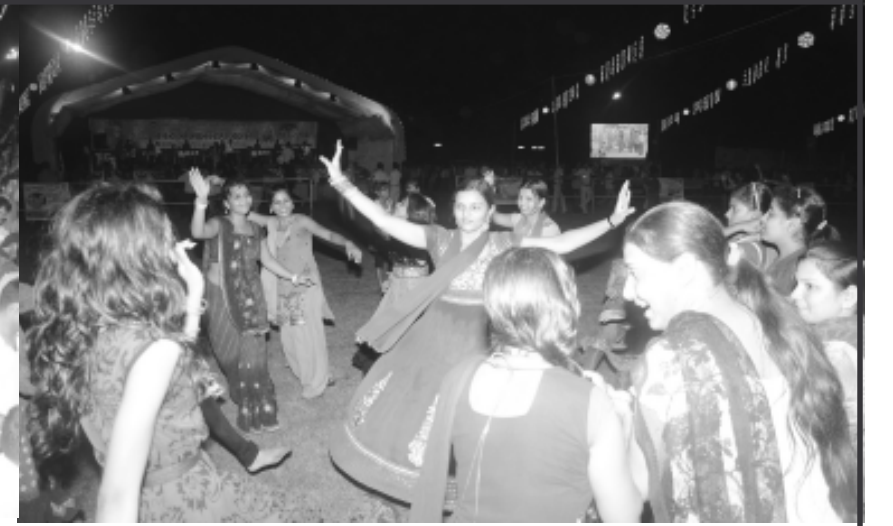
પાલનપુર શહેરની જાણીતી શૈક્ષણિક સંસ્થા વિદ્યામંદિરના જેન બાલમંદિર કે.આર. પરીખ બાલમંદિર અને જેન શિશુ શાળામાં ભૂલકાઓ દ્વારા શશીવનમાં ગરબાની રમઝટ માણ્યા બાદ આજે શાળા પ્રાંગણમાં વિજયા દશમીની પણ શાનદાર ઉજવણી કરાઈ હતી. શાળાના શિક્ષકોએ પ્રાંગણમાં આઠ ફુટ ઉંચું રાવણનું પૂતળું બનાવવામાં આવ્યું હતું અને તેનું ભવ્ય આતશબાજી સાથે દહન કરવામાં આવ્યું હતું.