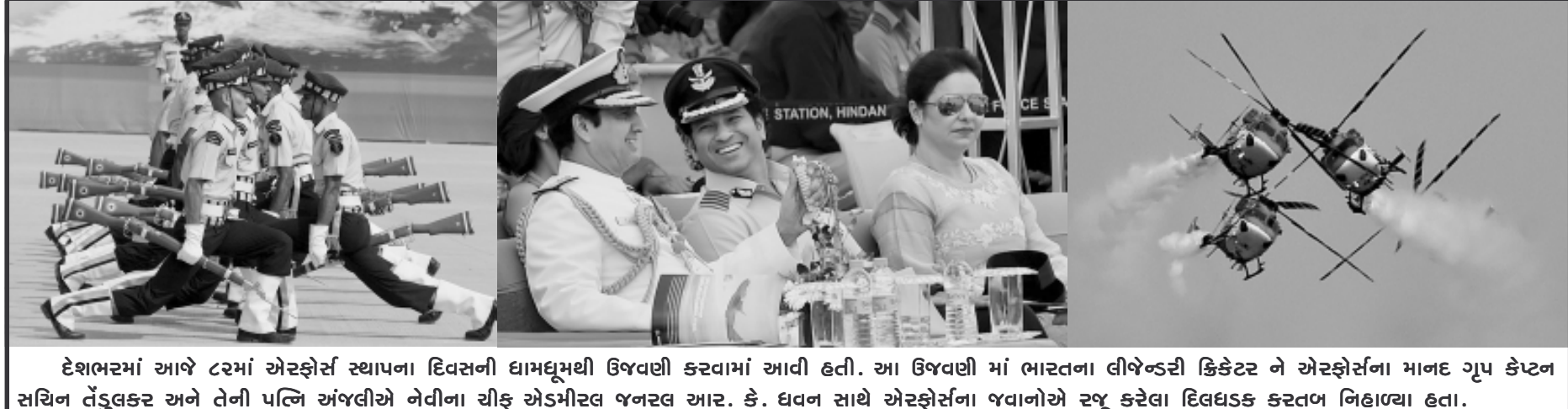
દેશભરમાં આજે ૮૨માં એરફોર્સ સ્થાપના દિવસની ધામધૂમથી ઉજવણી કરવામાં આવી હતી. આ ઉજવણી માં ભારતના લીજેન્ડરી કિકેટર ને એરફોર્સના માનદ ગૃપ કેપ્ટન સચિન તેંડુલકર અને તેની પત્નિ અંબલીએ નેવીના ચીફ એડમીરલ જનરલ આર. કે. ધવન સાથે એરફોર્સના જવાનોએ રજૂ કરેલા દિલધડક કરતળ નિહાળ્યા હતા.

શ્રીનગર, તા. ૮ સરહદ ઉપર તોપમારા અને ગોળીબારને વધુ તીવ્ર બનાવી દેવામાં આવ્યા બાદ પાકિસ્તાન અંગે જમ્મુ કાશ્મીરના મુખ્યમંત્રી ઓમર અબ્દુલ્લાએ પણ આકરી પ્રતિક્રિયા આપી છે. સાથે સાથે વહીવટીતંત્રને સરહદી વિસ્તારમાં રહેતા લોકોની સુરક્ષાની ખાતરી કરવા તમામ જરૂરી પગલા લેવા સૂચના આપી છે. મુખ્યમંત્રી ઓમર અબ્દુલ્લાએ કહ્યું છે કે, સરહદ ઉપર પરિસ્થિતિની સમીક્ષા કરવામાં આવી ચુકી છે. ભારે તોપમારા અને ગોળીબારના કારણે સરહદી વિસ્તારમાંથી ખસેડવામાં આવેલા ૧૬૦૦થી વધુ લોકોને આશ્રય આપવામાં આવી રહ્યો છે. મોટાપાયે ડિઝરત પણ થઈ છે. જુદા જુદા વિસ્તારમાં કેમ્પ પણ શરૂ કરવામાં આવ્યા છે. આ કેમ્પમાં તોપમારા અને ગોળીબારના કારણે અસરગ્રસ્ત લોકોને ખસેડવામાં આવ્યા છે. જમ્મુ, સાંબા, કથુઆ જિલ્લામાં ૨૪ કેમ્પ સ્થાપિત કરાયા છે. એવું જાણવા મળ્યું છે કે, ખાવા પીવાની ચીજવસ્તુઓ, દવાઓ, બ્લેન્કેટ અને અન્ય જરૂરી સુવિધા કેમ્પમાં રહેલા લોકોને પહોંચાડવામાં આવી રહી છે. મુખ્યમંત્રીએ સુરક્ષિત સ્થળોએ ખસી જવા તમામ લોકોને કહ્યું છે. અસરગ્રસ્ત લોકો માટે ખાનગી હોલ અને અન્ય સ્થળો પણ રાખવામાં આવ્યા છે. આગામી દિવસોમાં સ્થિતિ વધુ વણસે તેવા સંકેત પણ દેખાઈ રહ્યા છે. ઓમર અબ્દુલ્લાએ જમ્મુ પ્રદેશના ડિવિઝનલ વહીવટીતંત્રને કેટલીક સૂચના આપી છે. મુખ્યમંત્રીએ ડિવિઝનલ કમિશનરો, ઈન્સ્પેક્ટર જનરલ અને ડેપ્યુટી કમિશનર જમ્મુ સાથે વિડિયો કોન્ફરન્સિંગ કરી છે. સરહદી લોકો માટે કરવામાં આવેલી વ્યવસ્થા અંગે ચર્ચા કરવામાં આવી હતી. મુખ્યમંત્રીએ અસરગ્રસ્તોને કોઈ તકલીફ ન પડે તે માટે સૂચના આપી છે. ૭૦૦૦ લોકો હાલમાં રાહત કેમ્પોમાં પહોંચ્યા હોવાના અહેવાલ મળ્યા છે. અન્ય લોકો પણ પહોંચે તેવા સંકેત દેખાઈ રહ્યા છે.