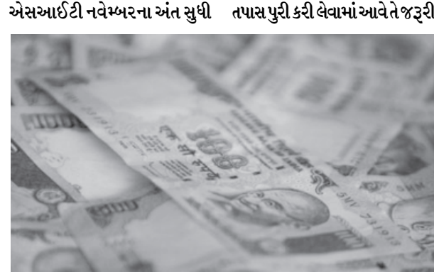
સ્ટેટસ રિપોર્ટ આપે અને ૩૧ મી માર્ચ ૨૦૧૫ સુધી તમામ ખાતાઓમાં

જીનેવા શાખામાં ખાતા ધરાવનાર ભારતીય લોકોના નામ સામેલ છે. આ એવા લોકો છે જે અંગે ભારત સરકારને જાણ નથી. ચીફ જસ્ટિસ એચએલ દત્તના નેતૃત્વમાં બેચને કેન્દ્ર સરકાર તરફથી સુપ્રત કરવામાં આવેલી યાદીના સીલ કવરને ખોલવાનો નિર્ણય કરાયો નથી. સુપ્રીમે કહ્યું હતું કે, આ સીલ કવરને માત્ર ખાસ તપાસ ટીમ એસઆઈટીના અધ્યક્ષ અને ઉપાધ્યક્ષ જ ખોલશે. સુપ્રીમ કોર્ટે એવો આદેશ કર્યો છે કે,