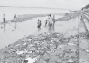
પ્રકાશ જાવડેકરે આવા ૭૬૪ પ્રદૂષણ ફેલાવતા ઉદ્યોગોની યાદી તૈયાર કરી હતી. પ્રદૂષણ ફેલાવતા ઔદ્યોગિક એકમો સામે કઠોર પગલા લેવા અને નિરીક્ષણ કરવા નેશનલ ગ્રીન ટ્રીબ્યુનલને સુપ્રીમે આદેશ કર્યો હતો. અગાઉ સરકારે એવા ઉદ્યોગોને કડક ચેતવણી આપી હતી જે ગંગા નદી અને તેની સહાયક નદીઓના કિનારા

ઉપર પ્રદૂષણ સાથે સંબંધિત ધારદોષોનો ખુલ્લો ભંગ કરી રહ્યા છે. દરમિયાન પર્યાવરણ પ્રધાન