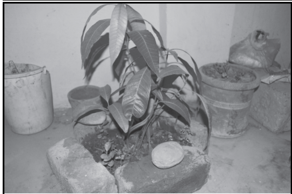
કુદરત ક્યારે કેવા ચમત્કાર કરે છે તે અકળ મનનો માનવી ક્યારેય જાણી શક્યો નથી અને જાણી પણ નહી શકે. બોરીજ ગામમાં મહંત ગંગારામ જેઠીદાસ સાધુ અને દર્શનભાઈ ગંગારામ સાધુ દ્વારા પ્રસ્થાપિત હનુમાન મંદિર પરિસરમાં કેરીનો એક ગોટલો વાલેલો જેમાં પાંચ ફણગા કુટ્યા છે. આને શ્રદ્ધાળુઓ ચમત્કાર કરી શકે, જ્યારે વિજ્ઞાન બીજુ કંઈ પણ કહી શકે. વાત ગમે તે હોય આ પંચમુખી આંબો જોવા લોકો અવશ્યપણે મુલાકાત લઈ રહ્યા છે.