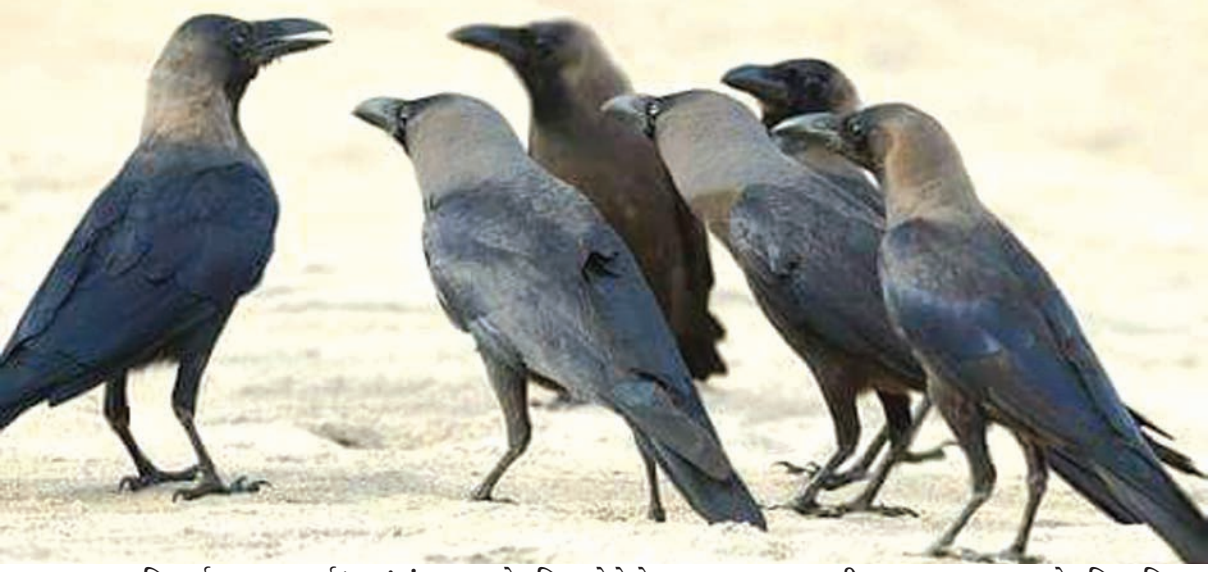
કાગવાસ - પિતૃ તર્પણના પાવન પર્વ 'શ્રાદ્ધ'માં કાગવાસનો મહિમા મોટો છે... ભાદરવા સુદ-પૂનમથી ભાદરવા સુદ-અમાસ સોળ દિવસ પિતૃપક્ષ તરીકે મનાવાય છે... પિતૃ સ્મૃતિ તાજ કરવા પરિવાર સદગતોને યાદ કરી કાગવાસ નામે છે... આપણી પરંપરામાં એમ પણ વર્ણવાયું છે કે, કાગડાને વાસ નાખવાથી પિતૃઓને ખાવાનું પહોંચે છે... કાગડાઓને ખીર-પુરી જમાડવાથી પૂર્વજો તર્પણ કર્યાનું કમાવાય છે એવી લોકપરંપરાના આધારે ભારતીય સમાજમાં શ્રાદ્ધપર્વ ભાવપૂર્વક ઉજવાય છે....