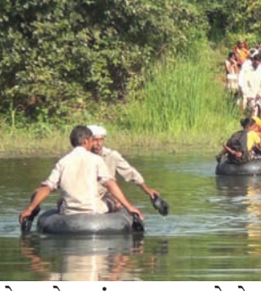
પરીદી માટે બીયાદ ગામ જ વિકલ્પ હોવાથી પરીદી માટે પણ ટ્યુબ જ એક માત્ર સહારો બની રહે છે આ ગામને નદી પર દીપ બનાવી આપવા અસંખ્ય વાર રજૂઆતો વહીવટી તંત્ર અને નેતા ઓને કરવામાં આવી હોવા છતાં રજૂઆત બહેરા કને અથડાઈ ને પરત આવી છે

બન્યા ત્યારે નદીના છેડે વસેલા પુરુષ વર્ગ એ કેટલીવાર નાના ભૂલકા ઓ અને વડીલો ના જીવ જીવના જોખમે બચાવ્યા હતા જીવતા જીવ નદી પાર કરવા ટ્યુબ સહારો છે પરંતુ મર્યા પછી પણ લાશ ને સ્મશાને લઈ જવા આ જ ટ્યુબ નો ઉપયોગ કરવો પડ્યો છે ત્યારે નાનકડા એવા આ ગામની પીડા ને કોઈ સમજશે ખરા અરવલ્લી જિલ્લા ના નાનકડા એવા ગામની વખો જૂની પીડા ના હલ માટે વાઈબ્રન્ટ અને ડીજીટલ ઈડિયા ની ગુલબાંગો પોકારતા રાજકીય નેતા ઓ ને સમય જ નથી ત્યારે વહીવટી