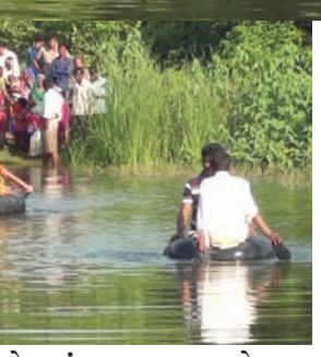
મોદરસુંબા ગામની મોદરસુંબા ગામની