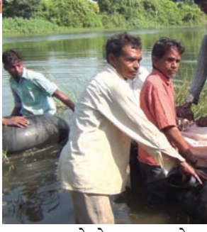
તંત્ર પણ આંખે પાટા બાંધી ને બેઠું હોય તેમ લાગી રહ્યું છે જીલ્લા કલેક્ટર નો આ સમસ્યા ના હલ માટે સમ્પર્ક કરતા તે ઓ વખતે માતાઓના જીવ હમેશા તાળવે ચેતેલા જ રહે છે અગાઉ નદી પસાર કરતી વખતે ટ્યુબ ફાટી જવા કે પંચર થઈ જવાના બનાવ