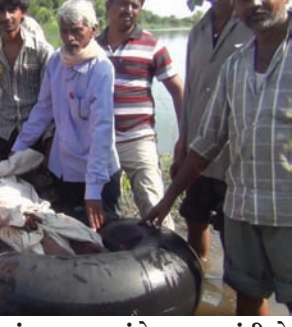
તંત્ર પણ આંખે પાટા બાંધી ને બેઠું હોય તેમ લાગી રહ્યું છે જીલ્લા કલેક્ટર નો આ સમસ્યા ના હલ માટે સમ્પર્ક કરતા તે ઓ વખતે માતાઓના જીવ હમેશા તાળવે ચેતેલા જ રહે છે અગાઉ નદી પસાર કરતી વખતે ટ્યુબ ફાટી જવા કે પંચર થઈ જવાના બનાવ

જીવના જોખમે વ્હાલસોયાને અભ્યાસ કરવાની ઘેલછા