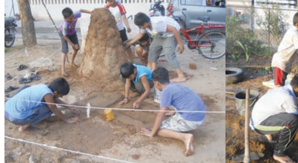
નવરાત્રી એટલે શકિત અને લઈ મહિલાઓ, યુવાનો સહિત તૈયારીઓમાં લાગી જાય છે.

રસ હોય છે. બાળકો પણ એકઠા થઈ પોતાની નવરાત્રીની તૈયારીમાં લાગી ગયા છે.