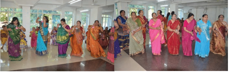
શેરી ગરબા - બ્રહ્મસમાજ સેક્ટર-૧૬ ખાતે બ્રહ્મસમાજ મહિલા પાંખ દ્વારા શેરી ગરબાનું આયોજન કરવામાં આવ્યું હતું. ગરબે ધુમવા સમાજની મહિલાઓ મોટી સંખ્યામાં જોડાઈ હતી.