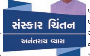
સંસ્કાર ચિંતન અનંતરાય વ્યાસ