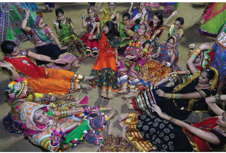
રંગે રમે, આનંદે રમે... - વરસાદના વિભવિનાની મંગળવારની રાત ખેલેલાઓ માટે ખીલવા અને ખુલવાની તક હતી... અવનવા પરિવેશમાં સજી-ધજીને આવેલા ખેલેલાઓએ અલગ-અલગ પ્રકારની કોરિયોગ્રાફીથી સમગ્ર માહોલને ઉત્સાહથી છલકાવી દીધો હતો....

સુરક્ષા અંગે કેબિનેટ સમિતિની બેઠકમાં વિવિધ પાસા પર ચર્ચા નવી દિલ્હી, તા. ૫ વડાપ્રધાન નરેન્દ્ર મોદીના નેતૃત્વમાં સુરક્ષા અંગેની કેબિનેટ સમિતિની મહત્વપૂર્ણ બેઠક મળી હતી. આ બેઠકમાં અંકુશ રેખા પાર કરીને પોકમાં કરવામાં આવેલા સર્જિકલ હુમલા બાદ ઉભી થયેલી સ્થિતિ ઉપર ચર્ચા વિચારણા કરવામાં આવી હતી. આજે યોજાયેલી સીસીએસની બેઠકમાં રાષ્ટ્રીય સુરક્ષા સલાહકાર અચૂત દોભાલે વડાપ્રધાન નરેન્દ્ર મોદી અને અન્યોને ઓછામાં ઓછા ૧૨ અન્ય ત્રાસવાદી કેમ્પ હાલમાં હોવા અંગે માહિતી આપી હતી. સેનાના સર્જિકલ હુમલા બાદ ૧૨ લેવ્ય પેડ હજુ પણ રહેલા છે. અહેવાલ મુજબ જુદી જુદી ઈન્ટેલીજન્સ સંસ્થાઓ દ્વારા એકત્રિત કરવામાં આવેલી માહિતીના આધાર પર દોભાલે માહિતી આપી હતી. ગયા સપ્તાહમાં અંકુશ રેખા પાર કરીને ભારતીય સેનાએ જોરદાર પોકમાં હુમલા કર્યા હતા. તમામ પ્રકારની માહિતી એકત્રિત કરવામાં આવી રહી છે. સૂત્રોએ દાવો કર્યો છે કે, નવા ત્રાસવાદી કેમ્પના સ્થળોને પણ ભારતીય ઈન્ટેલીજન્સ સંસ્થાઓ દ્વારા ઓળખી કાઢવામાં આવ્યા છે. બીજી બાજુ સર્જિકલ સ્ટ્રાઈકના પુરાવા જાહેર કરવાને લઈને સેનાને કોઈ વિરોધ ન હોવા છતાં મોદી સરકાર પુરાવા જારી કરવાના મુદ્દામાં દેખાઈ રહી નથી. આજે મહત્વપૂર્ણ બેઠક યોજાઈ હતી. સરકાર પહેલાથી જ નક્કી કરી ચુકી છે કે, સર્જિકલ સ્ટ્રાઈકના પુરાવા જારી કરવામાં આવશે નહીં. આ અગાઉ સેના તરફથી કહેવામાં આવ્યું હતું કે,