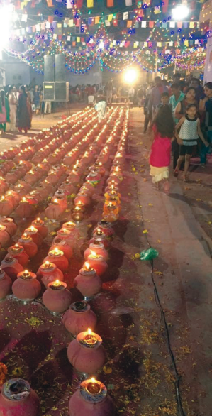
લવારપુર ગામે ભક્તિ-શ્રદ્ધાના રંગે ગરબા મહોત્સવ યોજાયો

ગાંધીનગર તાલુકાના લવારપુર ગામે દર વર્ષે પરંપરાગત રીતે નવરાત્રી પર્વ ભક્તિ અને શ્રદ્ધાના ઉમળકાભેર ઉજવણીનું આયોજન તોત્રી માતા યુવક મંડળ દ્વારા કરવામાં આવે છે. આ વર્ષે તોત્રી માતાના ચોકમાં મઢીને સોળે શણગાર અને રોશનીથી ઝગમગાટ અનોખુ આકર્ષક કેન્દ્ર બન્યું હતું. લવારપુર ગામમાં નવરાત્રી મહોત્સવ નિમિત્તે તોત્રી માતાજી પ્રત્યે અનોખી ભક્તિ અને શ્રદ્ધારૂપે ગ્રામજનો રંગભેરંગી માટીના ગરબાની બાધા માનતાના ગરબા માતાજીના ચોકમાં માતાજીના ગુણલાં ગાતાં અનોખી પૂજા-અર્ચના કરવામાં આવી હતી. તોત્રીમાતાજીની મઢી સામે એક સાથે એકત્રીત કરી શ્રદ્ધાળુ ગ્રામજનો ગરબે ધૂમી ભવ્ય ઉજવણી કરવામાં આવી હતી. આ ગરબા મહોત્સવમાં મહાઆરતીનો મહિમા અનોખો હોવાથી સમુદ આરતીનો વિશેષ લાભ લઈ ભક્તોજનો ધન્યતા અનુભવી હતી. મોટી રાત્રે ખેલેલા ગરબામાં ઉમંગભેર ઝૂમી વહેલી સવારે અબીલ ગુલાલની છોળો ઉડાડી માતાજીનો જયઘોષ સાથે ભાવભરી રીતે ગરબાને ભાઈઓ દ્વારા વિદાય આપી હતી.