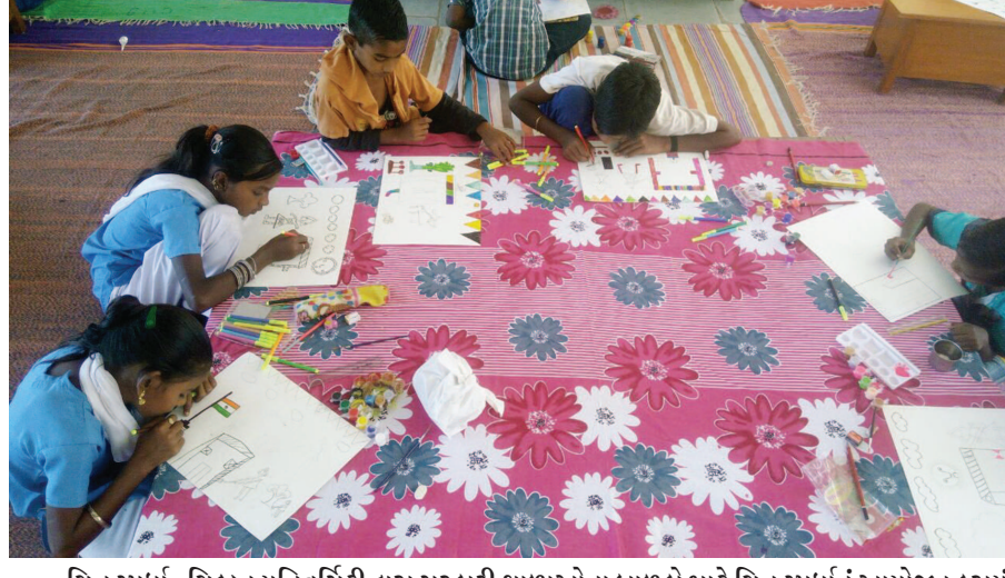
ચિત્ર સ્પર્ધા - ચિલ્ડ્રન યુનિવર્સિટી દ્વારા સરકારી શાળાઓના બાળકો માટે ચિત્ર સ્પર્ધાનું આયોજન કરાયું હતું... સર્જનાત્મક શક્તિ ખિલવવાની ભાગરૂપે બાળકોને ચોક્કસ વિષય પર પોતપોતાની કલ્પનાઓ કંડારવાની તક આપી હતી... શ્રામીણ વિસ્તારના બાળકોએ અદભૂત કલ્પનાશક્તિને કાગળ પર કંડારી હતી...