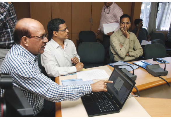
સુવિધા પુરી પાડવા પોલીસ સ્ટેશનના મોટા ભાગના કામ ઘરે બેઠા ઓનલાઈન થઈ શકે તેનુ પ્રયોજન કરવામાં આવ્યુ છે.

પોલીસ સ્ટેશનને લગતા મોટા ભાગના કામો ઘરે બેઠા ઓનલાઈન થઈ શકે તે માટે રાજ્યમાં સીટીઝન પોર્ટલ લોન્ચ ગાંધીનગર, તા. ૪ મુખ્યમંત્રી અને હાલના વડાપ્રધાન આગળ વધી રહ્યુ છે. નાગરીકોને ડ્રાઈવર, ઘર ઘાટી, નરેન્દ્ર મોદીએ ઈ.ગુજકોપ પ્રોજેક્ટ વધુમાં વધુ ટેકનોલોજીના માધ્યમથી ભાડુઆતની નોંધ કરાવવી હોય કે ચોરી થઈ હોય...! કોઈ ગુમ થયુ હોય કે ગુમ થયેલ વ્યક્તિઓની માહિતિ મેળવવી હોય...! એફઆઈઆરની પ્રમાણપત્ર અથવા ના વાંધા પ્રમાણપત્ર (એનઓસી) મેળવવું હોય...! આ કામોમાં પોલીસ સ્ટેશનના ધક્કા ખાઈને સામાન્ય નાગરીકો કંટાળી જતા હોય છે. પણ હવે પોલીસ સ્ટેશનના ધક્કા ખાવા પડશે નહી. હાશ પર લીધો હતો. આ પ્રોજેક્ટથી ગુલ વિભાગ પેપરલેસની દિશામાં વર્ષ-૨૦૧૬માં તત્કાલીન