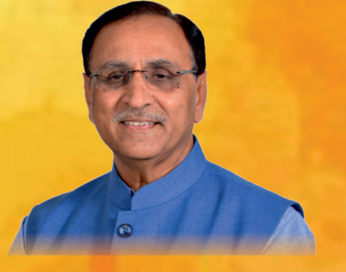
માનનીય શ્રી વિજય રૂપાણી મુખ્યમંત્રી, ગુજરાત રાજ્ય