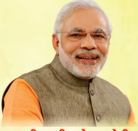
માનનીય શ્રી નરેન્દ્ર મોદી વડાપ્રધાન, ભારત સરકાર