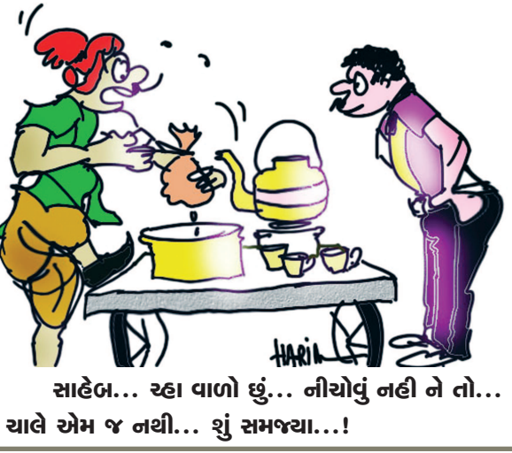
સાહેબ... રહા વાળો છું... નીચોવું નહીં ને તો... ચાલે એમ જ નથી... શું સમજ્યા...!