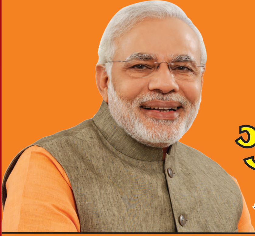
શ્રી નરેન્દ્રભાઈ મોદી વડાપ્રધાન, ભારત