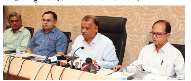
હોવાનું રાજ્યના ચૂંટણી અધિકારી સ્વૈને જણાવ્યું છે. હાલ સવારના ૮ મતગણતરીનું કામ જે તે જિલ્લા મથકો પર ૧૮મીએ સવારે

ગાંધીનગર, તા. ૨૫ ગાંધીનગર જિલ્લાની પાંચ બેઠકો સહિત ૧૪ જિલ્લાની ૯૩ બેઠકોનો ચૂંટણી જંગ ૧૪મી ડિસેમ્બરના રોજ યોજાશે. આ માટે ચૂંટણીનું જાહેરનામુ ૨૦-૧૧-૧૭ને સોમવારના રોજ જાહેર થતાં જ ઉમેદવારી પત્ર ભરવાની પ્રક્રિયાનો પ્રારંભ થશે. ઉમેદવારી પત્ર ભરવાનો