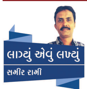
લાયું એવું લાયું સમીર રામી

ઈ-મેમોથી બચવા કરાતા ગતકડાં આપણી નિયમપાલન નહી કરવાની માનસિકતાને ખુલ્લી પાડે છે : વાહન ખરીદીમાં જેટલા આપણે પાવરધા છીએ તેટલા ટ્રાફિકના નિયમપાલનમાં બેદરકાર પણ છીએ : એટલેજ વિશ્વમાં સૌથી વધુ અકસ્માતો સર્જાએ છીએ