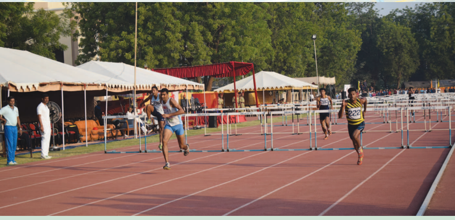
ગાંધીનગર ખાતેના બીએસએફના ગુજરાત ફિટ્નેસ એક્સપ્રેસ યજમાન પટે ૪૦મી ઓલ ઈન્ડિયા ઈન્ટર ફિટ્નેસ એથલેટિક્સ મીટ તથા પહેલી ઈન્ટર કમાન્ડ મહિલા બાસ્કેટબોલ સ્પર્ધા સેક્ટર-૧ પના સાઈ સ્ટેડિયમ તથા બીએસએફના સ્પોર્ટ્સ ક્લબ ગ્રાઉન્ડ ખાતે યોજાઈ છે. સ્પર્ધામાં વિવિધ એથલેટિક્સની રમતો જેવી કે અલગ અલગ અંતરની દોડ, વિન દોડ, ભલા ફેંક, ટ્રીપલ જમ્પ, હાઈ જમ્પ તેમજ અન્ય સ્પર્ધાઓ યોજાઈ હતી. આ સાથે મહિલા બાસ્કેટબોલ સ્પર્ધામાં વેસ્ટન કમાન્ડની ટીમ વિજેતા બની હતી જ્યારે ઈસ્ટન કમાન્ડની ટીમ રનર્સ અપ રહી હતી.