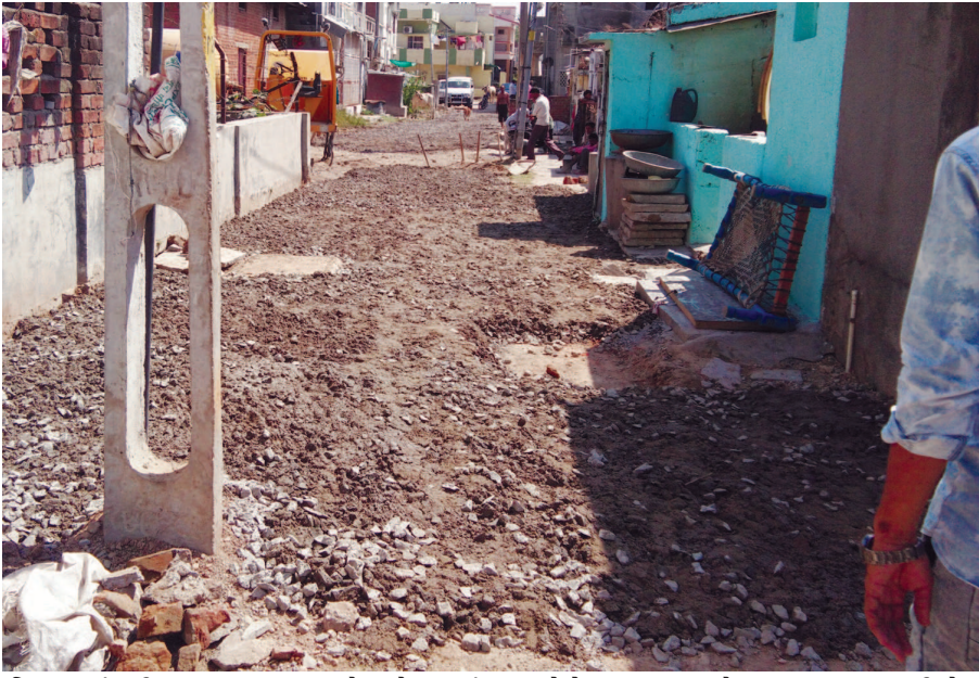
વિસ્તારમાં નવીન બનતા રોડમાં ભ્રષ્ટાચાર થતો હોવાનો નેતાએ પત્રમાં લખ્યું છે કે બની રહેલા રોડકામમાં પ્લાન શરતો મુજબ કામ થતું નથી જે કારણે યોગ્ય ગુણવત્તા

તલોદ, તા. ૨૯ આફીસરને પત્ર પાઠવી પાલિકા આક્ષેપ કર્યો છે. વિરોધ પક્ષના એસ્ટ્રીમેઈટ તેમજ ટેન્ડરની તલોદ નગરપાલિકા વિસ્તારમાં જુદા જુદા સ્થળે પૂર ઝડપે નવીન રોડ બનાવવામાં આવી રહ્યા છે. આ રોડ બનાવવામાં ટેન્ડરની શરતોનો ભંગ થઈ રહ્યો છે. તેમજ યોગ્ય ગુણવત્તા જળવાતી નથી. આડેઘડ કામ કરાવવાનો વિરોધ પક્ષના નેતાએ સત્તાવાળાઓને પત્ર લખી આક્ષેપ કર્યો છે. વધુમાં યોગ્ય તપાસ કરવામાં નહીં આવે તો પાલિકા સમક્ષ જાહેરમાં ધરણા યોજી પ્રદર્શન કરવાની પણ ચિમકી ઉઠાવે છે.