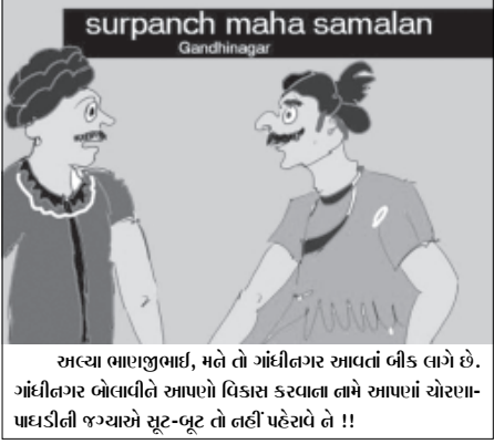
સત્યા ભાગ્યભાઈ, મને તો ગાંધીનગર આવતાં બીક લાગે છે. ગાંધીનગર બેલાલીને સાપાળો વિકાસ કરવાલા તમે સાપાળાં ચોરણા-પાણીની જગ્યાએ ચૂટ-ભૂટ તો નહીં પહેરવે તો !!