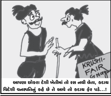
આપણા છોકરા દેશી ખેતીમાં તો રસ નથી લેતા, કદાચ વિદેશી વનસ્પતિનું કહે છે તે આવે તો કદાચ ફેર પડે...