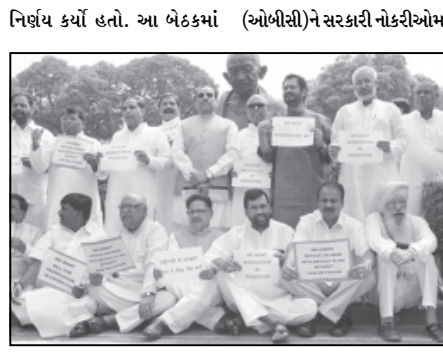
મોટાભાગના રાજકીય પક્ષોએ વેધાનિક રીતે વધુ મજબૂત કાયદાની માંગ કરી હતી. વડાપ્રધાને બેઠક દરમિયાન કહ્યું હતું કે સરકાર આ સંદર્ભમાં સુધારા લાવવાની તરફેણમાં છે. આના તમામ પક્ષોમાં કાયદાકીય રીતે ચકાસણી કરવામાં આવશે.

નિર્ણય કર્યો હતો. આ બેઠકમાં (ઓબીસી)ને સરકારી નોકરીઓમાં છતાં આ બિલને મંજૂરી આપી છે. અહેવાલ મુજબ સરકારે મુલાકાતોને પાતરી આપી છે કે ઓબીસીને પણ મોડેથી બિલની સમીક્ષા હેઠળ આવરી લેવામાં આવશે. ગયા મહિને વડાપ્રધાન મનમોહનસિંહ સર્વપક્ષીય મિટિંગ બોલાવી હતી. બહુજન સમાજ પાર્ટીએ આ બિલને મજબૂત ટેકો આપ્યો હતો અને સુધારા બિલ રજૂ કરવાની તરફેણ કરી હતી. બઢતી સાથે સંબંધિત મામલાઓમાં દલિતોને રાહત મળે તેવી રજૂઆત માયાવતી દ્વારા કરવામાં આવી હતી. કોલસા બ્લોક ફાળવણીના મામલે સંસદમાં ઊભી થયેલી મડાગાંઠને ઉકેલવાના હેતુસર આ બિલને લીલીઝંડી આપી છે. કોંગ્રેસને આશા છે કે ભાજપ બિલના ટેકામાં આવશે જેથી સંસદમાં ૧૦ દિવસથી ચાલતા વિરોધનો અંત આવશે. જો કે બિલમાં ચોક્કસ ન્યાયીક ચકાસણીની પણ વ્યવસ્થા છે.