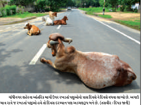
ગાંધીનગર શહેરના આંતરિક માર્ગો ઉપર રખડતાં પશુઓનો ત્રાસ દિવસે ને દિવસે વધવા લાગ્યો છે. અગાઉ માત્ર રાત્રે જ રખડતાં પશુઓ હોત તો હવે દરમિયાન પણ અડચણરૂપ બને છે.

વરસાદથી નગરનું સૌંદર્ય ખીલી ઉઠ્યું ગાંધીનગર, તા. ૬ ગાંધીનગરનું સૌંદર્ય સોળે કળાએ ખીલી ઉઠ્યું છે. છેલ્લા કેટલાક દિવસોથી સતત પડી રહેલા વરસાદને પગલે જ્યાં નજર ફેરવે ત્યાં લીલોતરી જોવા મળી રહી છે. શહેરનો માહોલ અદ્ભુત થઈ ગયો છે.