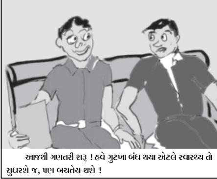
આજથી ગણતરી શરૂ ! હવે ગુટખા બંધ થયા એટલે સ્વાસ્થ્ય તો સુધરશે જ, પણ બચવેય થશે !

જે.એમ. ચૌધરી કન્યા વિદ્યાલય જુડો સ્પર્ધામાં મેદાન માર્યું