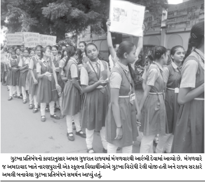
ગુટખા પ્રતિબંધનો કાયદાનુસાર અમલ ગુજરાત રાજ્યમાં મંગળવારથી આરંભી દેવામાં આવ્યો છે. મંગળવારે જ અમદાવાદ ખાતે નારણપુરાની એક સ્કૂલના વિદ્યાર્થીઓએ ગુટખા વિરોધી રેલી યોજી હતી અને રાજ્ય સરકારે અમલી બનાવેલા ગુટખા પ્રતિબંધને સમર્થન આપ્યું હતું.

આધુનિક અને અનુઆધુનિક ગુજરાતી ટૂંકી વાર્તાની આજની ગતિવિધિ રજૂ કરીને હિમાંશી શેલત અને કિરીટ દૂધાતની વાર્તાઓનાં દૃષ્ટાંતો આપ્યા હતા. તા. ૯-૯-૧૨ શનિવારે યોગેશ જોષીએ મધુસૂદન ઢાંકીની 'તામ્રશાસન' વાર્તાને કેન્દ્રમાં રાખીને વાત કરી હતી. એમણે વાર્તા અને વાર્તાકાર બંનેની વિલક્ષણતાઓ પરિચય કરાવ્યો હતો. તા. ૯-૯-૧૨ રવિવારે જગદીશ ગૂર્જરે સુરેશ જોષીની વાર્તા 'સંચલ' 'ગુહરવેશ'ની 'જન્મોત્સવ', 'નળદમયંતી' વગેરે વાર્તાઓને કેન્દ્રમાં રાખીને વાત કરી હતી. સમગ્ર શિબિર દરમિયાન વિદ્યાર્થીઓએ વાયનની સાથે લેખની પ્રવૃત્તિ પણ કરી હતી. વિદ્યાર્થીઓના જુદા જુદા જુથો વચ્ચે પુસ્તક સમીક્ષા અને સાહિત્યિક પ્રશ્નોત્તરીની સ્પર્ધા પણ રાખવામાં આવી હતી. શનિવારે બપોર પછી જહાણી માતાના મંદિરે વાયનનો કાર્યક્રમ રાખવામાં આવ્યો હતો. અહીં ધવનિર પારેખે ગુજરાતી ભાષા કઈ રીતે વિદ્યારથીઓને ઉપયોગી નીવડી શકે એ વિશે માર્ગદર્શન આપ્યું હતું.