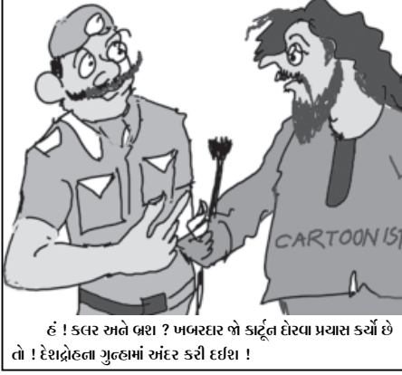
હં ! કલર રાને બરા ? ખબરદાર જો કાટૂંલ દોરવા પ્રયાસ કર્યો છે તો ! દેશદ્રોહના ગુલમાં અંદર કરી દર્શા !