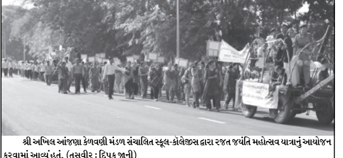
શ્રી અખિલ આંજણા કેળવણી મંડળ સંચાલિત સ્કૂલ-કોલેજીસ દ્વારા રજત જયંતિ મહોત્સવ યાત્રાનું આયોજન કરવામાં આવ્યું હતું.