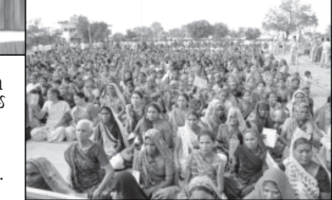
તેમણે જણાવ્યું હતું કે તમારે ટીકાઓ કરવી હોય તો અમારી કરો ગુજરાતની ટીકા કરવાનું છોડી દો. તેમણે વર્ષ બેટીંગ કરી હતી હવે અમારો બેટમેન ૧૦ વર્ષથી બેટીંગ કરે છે હવે તેમે ફીલ્ડીંગ ભર્યા કરો.