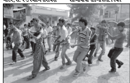
પહોંચતા ભાવિકોએ આતશબાજી કરી ગરબાની રમણટ બોલાવી હતી. શોભાયાત્રામાં જાહેરમાજના