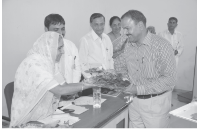
શ્રી અખિલ આંજણા કેળવણી મંડળ સંચાલિત ચૌધરી ટેકનીકલ ઈન્સ્ટીટ્યુટ, સેક્ટર-૭ ખાતે વાર્ષિક ઈનામ વિતરણ કાર્યક્રમનું આયોજન કરવામાં આવ્યું હતું.

અમદાવાદ, તા. ૨૩ મુખ્યમંત્રી નરેન્દ્ર મોદીના કાર્યક્રમમાં વિદ્યાર્થીઓને હાજર રાખવા માટે વીર નર્મદ દક્ષિણ ગુજરાત યુનિવર્સિટીએ આવતીકાલે સોમવારે લેવાનારી પરીક્ષા રદ કરતાં ૪૦ હજાર વિદ્યાર્થીઓના ભવિષ્યને અસર થશે. આવતીકાલે સોમવારે સુરતમાં ઈન્ડોર સ્ટેડિયમમાં યોજાનારી યુવા પરિષદમાં નરેન્દ્ર મોદીને હઠાલા થવા વીર નર્મદ દક્ષિણ ગુજરાત યુનિવર્સિટીના સત્તાધીશોએ દરેક કોલેજના અધ્યાપક સહિત વિદ્યાર્થીઓને હાજર રાખવા કરતાં સમગ્ર શિક્ષણ અલભ્યમાં ક્યવાટ ફેલાયો છે. વીર નર્મદ દક્ષિણ ગુજરાત યુનિ.નાં વિદ્યાર્થીઓને નરેન્દ્ર મોદીના કાર્યક્રમમાં હાજર રાખવા વિદ્યાર્થીઓની પરીક્ષા રદ કરી દેવાઈ છે. પરીક્ષા રદ કરી દેવાતા ૪૦,૦૦૦ વિદ્યાર્થીઓના ભવિષ્ય સાથે ચેડા થતાં વિદ્યાર્થીઓને અસર થશે. કુલપતિએ દરેક વિદ્યાર્થીને એસ.એમ.એસ. કરી આ કાર્યક્રમમાં જોડાઈ ભગવાકરણ કરવા યુનિવર્સિટી ભાજપની પાંખ હોય તેમ વિદ્યાર્થીઓ વધારે જોતરાય તે માટે બસોની વ્યવસ્થા પણ કરી છે. ઈન્ડોર-નલ પરીક્ષા દરેક વિદ્યાર્થી માટે મહત્વની હોય છે. નરેન્દ્ર મોદીની ગુડવીલમાં નામ નોંધવા યુનિવર્સિટી ચાન્સલર ભાજપનાં એજન્ટ બન્યાં હોય તેમ દરેક કોલેજનાં આચાર્યને ૨૦૦થી ૨૫૦ જેટલાં વિદ્યાર્થીઓ ઈન્ડોર સ્ટેડિયમમાં લાવવા ફરજિયાત આદેશ કરાયો છે. આવતીકાલે એન.એસ.યુ.આર.ના આગેવાનો તથા વિદ્યાર્થીઓ કાળા કપડાં દારણ કરી સેન્ટ્રોઉપર તથા આજોપર નરેન્દ્ર મોદીના કાર્યક્રમનો વિરોધ પ્રદર્શિત કરશે.