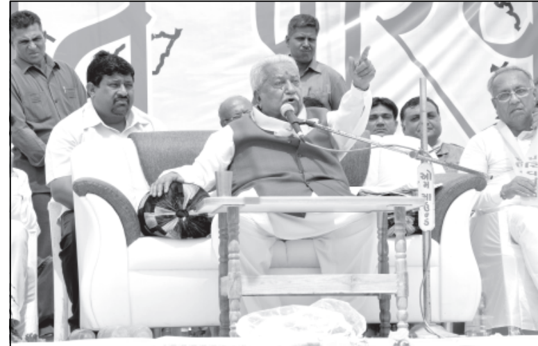
ગુજરાત પરિવર્તન પાર્ટી દ્વારા આગામી વિધાનસભાની ચૂંટણીને અનુલક્ષીને રાજ્યભરમાં યાત્રાનું આયોજન કરવામાં આવ્યું છે. ગુરુવારે વીરપુરથી આ યાત્રાનો આરંભ કરવામાં આવ્યો હતો. પાર્ટીના અધ્યક્ષ કેશુભાઈ પટેલે આ પ્રસંગે ઉદ્બોધન કર્યો હતો.

છત્રાલ જીઆઈડીસીમાં વેલ્વેટની ફેક્ટરીમાં આગ કલોલ, તા. ૨૦ કલોલની છત્રાલ જીઆઈડીસીમાં આવેલી ગુજરાત ફલોટેક્સ પ્રા.લી.માં વેલ્વેટના કાપડના પડદા તૈયાર થાય છે. ગઈકાલે સાંજના સુમારે આ વેલ્વેટની ફેક્ટરીમાં અચાનક શોર્ટસર્કીટ થતા કાપડે આગ પકડી લીધી અને થીમે થીમે આગ મોટું સ્વરૂપ ધારણ કરી દીધી હતી. કામદારો સહીત માલિક દોડીને ફેક્ટરીની બહાર નીકળી જતા કોઈને ઈજા કે જાનહાની થવા પામી ન હતી. કલોલ ફાયરબ્રિગેડને આ અંગે જાણ કરતાં કાયરની ટીમ ઘટનાસ્થળે આવી પહોંચી હતી. અને પાણીનો મારો ચલાવી આગને કાબુમાં મેળવી લીધી હતી. ફેક્ટરીમાં વેલ્વેટનો જથ્થો બળીને ખાખ થઈ ગયો હતો. સદનસીબે જાનહાની થવા પામી ન હતી.