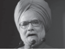
ડીઝલની કિંમતમાં ભાવ વધારાનાં

છે. દેશનાં હિતમાં જે જરૂરી છે તે તમામ પગલાં લેવાઈ રહ્યાં છે. મલ્ટીબ્રાન્ડ રિટેલમાં એફડીઆઈ, નિર્ણયને પરત ખેંચવાનાં પ્રશ્નો કરવામાં આવ્યા હતાં. સાથી પક્ષો દ્વારા વ્યક્ત કરવામાં આવેલી વિંતાની તેઓએ નોંધ લીધી નહતી. આ સમાહ દરમિયાન યુરોપી સંકલન સમિતિએ મલ્ટીબ્રાન્ડ રિટેલમાં એફડીઆઈનાં મુદ્દા પર ચર્ચા કરી છે. એફડીઆઈનો નિર્ણય અમેરિકાને ખુશ કરવાનાં હેતુસર લેવાયો છે તેવા ગુજરાતનાં મુખ્યમંત્રી મોદીના આશ્પે અંગે