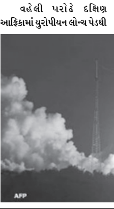
વહેલી પરોડે દક્ષિણ આફ્રિકામાં યુરોપીયન લોંચ પેડેથી

ઉપલબ્ધ થઈ જશે. ભારતના સૌથી ભારે સેટેલાઈટ જીસેટ-૧૦ને સફળ રીતે લોંચ કરવામાં આવતા ભારતે આંતરિક્ષાના ક્ષેત્રમાં વધુ એક સફળતા મેળવી લીધી છે. ભારતના અદ્યતન આધુનિક દુરસંચાર સેટેલાઈટ જીસેટ-૧૦નું વજન ઉડાણ વખતે ૩૪૦૦ કિલોગ્રામ હોવાનું જાણવા મળ્યું છે. ભારતીય અવકાશ સંશોધન સંસ્થા ઈસરોના ૧૦૧માં સ્પેશ મિશન તરીકે આને જોવામાં આવે છે. બેંગ્લોર હેડક્વાર્ટરમાં ઈસરોના જણાવ્યા મુજબ આમાં ૩૦ ક્રોમ્યુનિકેશન ટ્રાન્સપોન્ડરો રાખવામાં આવ્યા છે.