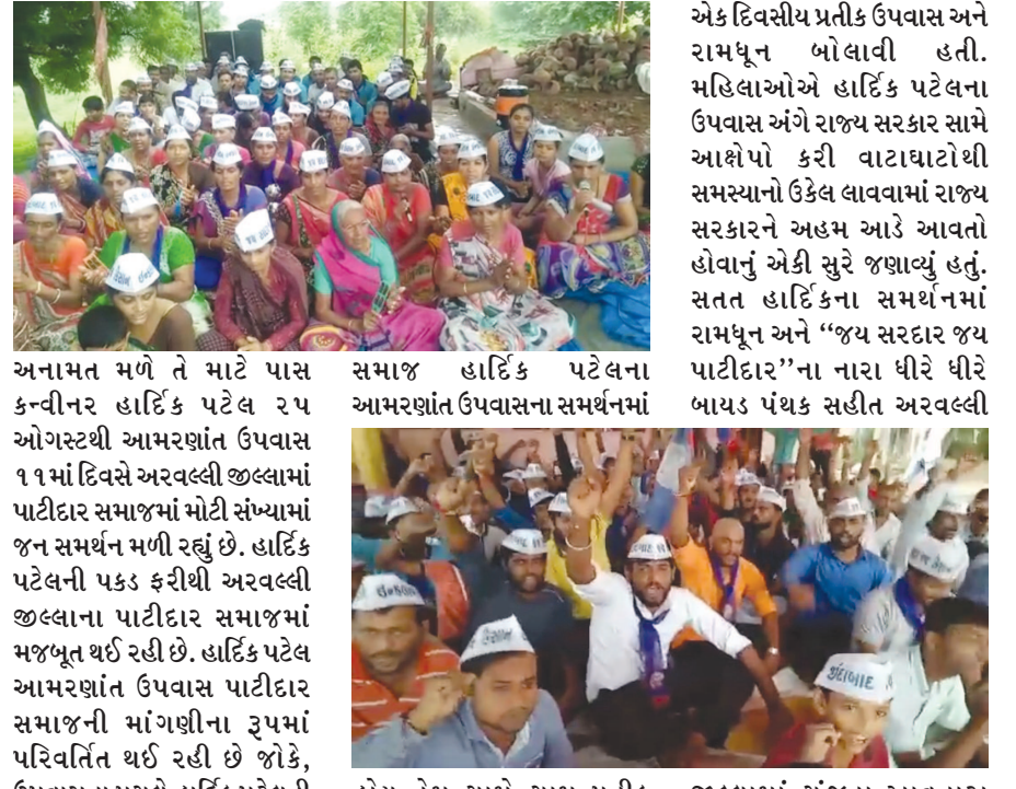
રોષ પ્રવર્તી રહ્યો છે. બાયડ તાલુકાના બોરલ, વાસણીરેલ, કાશીપુરા, ફતેપુરા એક દિવસથી પ્રતીક ઉપવાસ અને રામઘૂન બોલાવી હતી. મહિલાઓએ હાર્દિક પટેલના ઉપવાસ અંગે રાજ્ય સરકાર સામે આશંકા કરી વાટાઘાટોથી સમસ્યાનો ઉકેલ લાવવામાં રાજ્ય સરકારને અહમ આડે આવતો હોવાનું એકી સુરે જણાવ્યું હતું. સતત હાર્દિકના સમર્થનમાં રામઘૂન અને “જય સરદાર જય પાટીદાર” ના નારા ધીરે ધીરે બાયડ પંથક સહીત અરવલ્લી સમાજ હાર્દિક પટેલના આમરણાંત ઉપવાસના સમર્થનમાં

મોડાસા, તા. ૪ ગુજરાતના ખેડૂતોના દેવા માફી અને પાટીદાર સમાજને પટેલ માટેની સહાયનું ભવિષ્ય છે. અરવલ્લી જિલ્લાના બાયડ તાલુકામાં તો સમગ્ર પાટીદાર