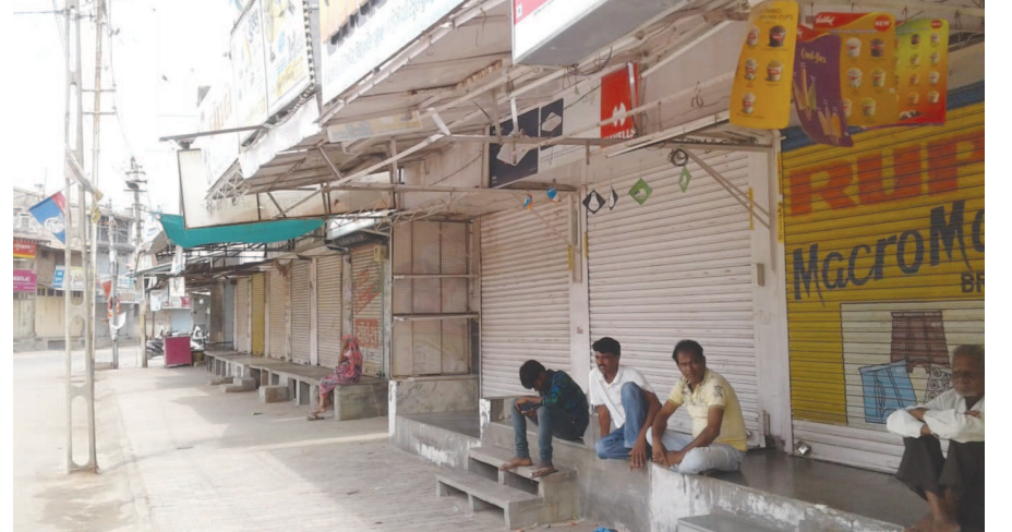
ગત રવિવારે હિંમતનગર તાલુકાના ગઢોડા ગામેથી સોલા જવા માટે નીકળેલ પાટીદારોની મા ઉમાના રથ સાથેની યાત્રાને માર્ગમાં પોલીસે અટકાવીને કથિત દમન ગુજરાતમાં પાટીદારોના ગઢ એવા ઊંઝા શહેરમાં તેના ઘેરા પ્રત્યાઘાત પડ્યા હતા. ઉમિયા માતાજીના રથને અટકાવીને પાટીદાર ભાઈ-બહેનો, બાળકો પર પોલીસે ગુજરેલ કથિત દમનના વિરોધમાં આજે બપોરના બાર વાગ્યા પછીથી ઊંઝા શહેરમાં સંપૂર્ણ બંધ પળાવ્યો હતો. શહેરના વિવિધ બજારો, મેઈન રોડ પરની દુકાનો, ઔદ્યોગિક એકમો, માર્કેટયાર્ડ વગેરે બંધ રહ્યા હતા.

હાર્દિકના સમર્થનમાં અનેક સ્થળો રામઘૂન અને ઉપવાસ શરૂ થયા, કેટલાક પાટીદારોએ મૂંડળ કરાવ્યા : આંદોલન ઠારવા તંત્રના પ્રયાસો નિષ્ફળ હિંમતનગર, તા. ૪ દસ દિવસ અગાઉ કિસાનોના દેવા માફી તથા પાટીદાર અનામત આંદોલનને આગળ વધારવા માટે હાર્દિક પટેલે અમદાવાદ ખાતે ઉપવાસ આંદોલન શરૂ કર્યું છે. ત્યારે સાબરકાંઠામાં પણ ત્રણ દિવસથી તેના સમર્થનમાં અનેક લોકોએ બેઠક બહાર આવી જાણે કે સરકાર સામે બંડ પોકાર્યાં હોય તેમ કાયદાની પરવા કર્યા વિના વિવિધ કાર્યક્રમો યોજવાનું શરૂ કરી દીધું છે. જેના કારણે સાબરકાંઠામાં અનામત આંદોલન ફરીથી વેગવેતું બની રહ્યું છે. જેના કેવા પરિણામ આવે છે તે સમય બતાવશે. આ અંગેની વિગત એવી છે કે અમદાવાદમાં હાર્દિક પટેલે શરૂ કરેલા ઉપવાસ આંદોલન બાદ સાબરકાંઠામાં સૌ પ્રથમ હિંમતનગર તાલુકામાં તેના સમર્થનમાં વિવિધ કાર્યક્રમો તથા પદયાત્રાનું આયોજન કર્યું હતું અને હવે આ આંદોલન જિલ્લાના અનેક ગામો સુધી પહોંચી ગયું છે ત્યારે સોમવારે અને મંગળવારે અનેક ગામોમાં પાટીદારોએ મંદિરોમાં રામઘૂન શરૂ કરીને માથે પાટીદારના લખાણવાળી ટોપી તથા ખેસ ધારણ કરી લોકોમાં અનામત આંદોલન અંગે જાગૃતિ લાવવાના કામ શરૂ કરી દીધા છે. પ્રાંતિજ તાલુકાના નાનાનપુર ગામના હર્ષદ પટેલ નામના યુવાને મંગળવારથી અનશન શરૂ કરી એવી જાહેરાત કરી છે કે જ્યાં સુધી હાર્દિક ઉપવાસ નહીં છોડે ત્યાં સુધી હું પણ મારા ઉપવાસ ચાલુ રાખીશ. ઉપરાંત પ્રાંતિજ તાલુકાના બાલીસણા ગામના કેટલાક પાટીદારોએ ૧૦૦ લિટર દૂધ હાર્દિકની છાવણીમાં મંગળવારે મોકલી આપીને અનોખું સમર્થન આપ્યું હતું.