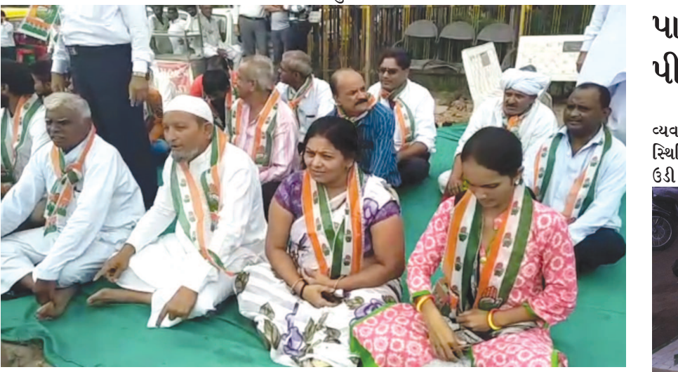
પાલનપુર ખાતે કોંગ્રેસના ખેડૂતોની દેવામાફી-મોંઘવારી સામે ઘરણાં

ભાઈ બહાર જઈને ઉપવાસ છાવણીમાં પરત ફરતો હતો ત્યારે તેને પોલીસે રોકતા હાર્દિક ગિચાઓ હતો. આ વાતની ઉપવાસ કરી રહેલા હાર્દિકને જાણ થતાં તે ગુસ્સે ભરાયો હતો અને ગાડીમાં બેસીને ગેટ બહાર નીકળ્યો હતો અને પોલીસની સાથે બોલાચાલી કરી હતી અને પોતાના કુટુંબીને રોકવાના ના હોય. મારો ભાઈ કે પરિવારનો કોઈ સભ્ય બહાર જઈને આવે તેને રોકવાનો ના હોય. પોલીસવાળા તેની તમામ દાદાગીરી અને હદ વટાવી ચૂક્યા છે. ગાડીમાં બેસીને ગેટ બહાર જઈને હાર્દિકે પોલીસને સ્પષ્ટ કહી દીધું હતું કે, મારા કુટુંબવાળાને રોકવાના નહી. પોલીસ કાયદાની મર્યાદામાં રહીને તેની ડ્યુટી કરે, હાંશિયારીમાં રહેવાનું. મારા કુટુંબવાળાને કોઈને રોકવા નહી એ તમને સાફ શબ્દોમાં કહી દઉં છું. જો કે, પોલીસે પણ મામલાની ગંભીરતા સમજ શાણપણથી કામ લીધુ હતુ અને તેથી મામલો થાળે પડ્યો હતો.