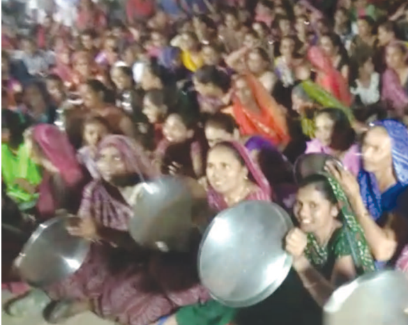
૧૬ દિવસ થવા છતાં સરકાર જાગતી નથી. ત્યારે ગઠ ગામની પાટીદાર મહિલાઓ હાર્દિકની વધારે ચડી હતી.

સુરોચ્યાર કર્યો હતો. જયારે બહેરી સરકારને જગાડવા માટે