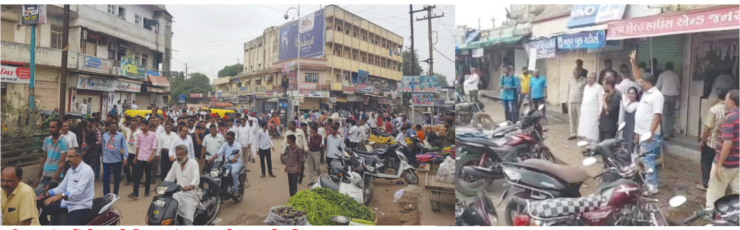
ડીસામાં કોંગ્રેસ પ્રેરિત બંધના એલાનને નિષ્ફળતા

અંગે તથા દૂધના એકત્રીકરણમાં માહિતી ટેકનોલોજી, પશુઓને પોષણ તથા સંવર્ધન અંગે પોતાના અનુભવો વ્યક્ત કર્યા હતા. રાધા મોહનસિંહે પશુ આહાર અંગેના એન.ડી.ડી.ના કન્વેલિટી માર્ક લોગોનું વિમોચન કર્યું હતું. પશુ આહાર/મિનરલ સિક્વન્સના વેલા ઉપર કન્વેલિટી માર્કનો લોગો હોય તો ઉત્પાદકોએ સ્ટાન્ડર્ડ ઓપરેટીંગ પ્રોસીજર્સ અપનાવી હોવાનો સંદેશો વ્યક્ત થાય છે. જરૂરી માત્રામાં ખનિજો અને વિટામીન હોય તો દૂધ આપતા પશુઓની ઉત્પાદન કાર્યક્ષમતામાં વધારો થાય છે. તેમણે એન.ડી.ડી.ના કન્વેલિટી માર્ક લોગો અને તેના પશુ આહારમાં ફાયદા દર્શાવતી ટીવી જાહેરાતની રજૂઆત કરી હતી.