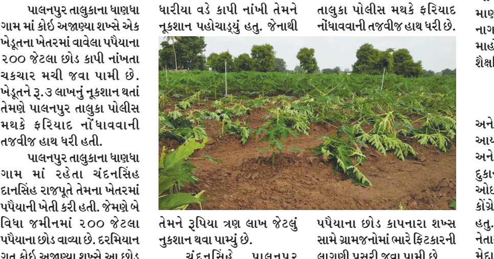
તાલુકા પોલીસ મથકે ફરિયાદ નોંધાવવાની તજવીજ હાથ ધરી છે.

પપૈયાના ૨૦૦ જેટલા છોડ કાપી નાંખતા ચક્રચાર મચી જવા પામી છે.