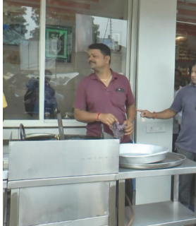
ભાખરીયા વિસ્તારમાં બજાર ખુલ્લું