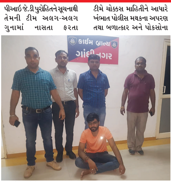
આરોપીઓને પકડવા સક્રિય થયેલી છે ત્યારે ગઈકાલે પી.એસ.આઈ.એચ.કે.સોલંકીની ટીમે ચોકસ માહિતીને આધારે ખંભાત પોલીસ મથકના અપરણ તથા બળાત્કાર અને પોકોસના

ગાંધીનગર, તા. ૧૨ ગાંધીનગર શહેર નજીક આવેલા સરઢવ ગામમાં રહેતા એક યુવાને ઈન્સ્ટાગ્રામ સોશિયલ મીડિયા એપ પરથી ખંભાતની એક સગીર વયની કિશોરીને ફેંડ બનાવી હતી અને ત્યારબાદ પોતાનો મોબાઈલ નંબર આપી લલચાવી-ફોસલાવીને લગ્ન કરવાના ઈરાદે ભગાડી જઈ બળાત્કાર ગુજાર્યો હતો. આ મામલે યુવાન સામે ખંભાત પોલીસ સ્ટેશનમાં ગુનો દાખલ થયો હતો. અપહરણ અને બળાત્કારના ગુનામાં નાસતો-ફરતો આ સરઢવ ગામનો આરોપી ગઈ કાલે ગાંધીનગર એસીબીની ટીમના સર્કજમાં આવી હતો. એલસીબીની ટીમે તેની ધરપકડ કરી ખંભાત પોલીસને સોંપવા કાર્યવાહી શરૂ કરી છે. ગાંધીનગર એલસીબી