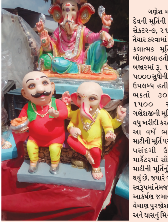
ગણેશ ચતુર્થીના પાવન દિવસની પૂર્વ સંધ્યાએ બજારમાં દુંદાળા દેવની મૂર્તિની ખરીદી કરવા ભકતોની ભારે ભીડ જામી હતી. શહેરના સેક્ટર-૭, ૨૧, ૨૪, અને ઘ-૫ પાસે આવેલા બજારમાં કારીગરો દ્વારા તૈયાર કરવામાં આવેલી કલાત્મક મૂર્તિઓની બોલબાલા હતી. જ્યારે બજારમાં રૂ. ૧૫૦ થી ૫૦૦૦ સુધીની મૂર્તિઓ ઉપલબ્ધ હતી, જેમાં ભકતો ૩૦૦ થી ૧૫૦૦ સુધીની ગણેશજીની મૂર્તિ સૌથી વધુ ખરીદી કરતા હતા. આ વર્ષે ભકતોએ માટીની મૂર્તિ પર વિશેષ પસંદગી ઉતારતા માર્કેટમાં સૌથી વધુ માટીની મૂર્તિનું વેચાણ થયું છે. જ્યારે બજારમાં મોટું-પતલું, બાહુબલી, કારમાં બેઠેલા, શ્રીકૃષ્ણના સ્વરૂપમાં તેમજ ડાયમંડવર્કથી શણગાર કરેલી કલાત્મક મૂર્તિઓએ બજારમાં આકર્ષણ જમાવ્યું હતું. જ્યારે ગત વર્ષે બજારમાં પીઓપીની મૂર્તિઓનું વેચાણ પુરજોશમાં થયું હતું. પરંતુ આ વર્ષે કારીગરોએ માટી, ચુનો, રાખ અને ઘાસનું મિશ્રણ કરીને તૈયાર કરવામાં આવી છે. જ્યારે કારીગરો માટી

મોટું-પતલું, બાહુબલી અને ડાયમંડ વર્કથી સુશોભિત મૂર્તિઓ પ્રત્યે ભાવિકોનું વિશેષ આકર્ષણ