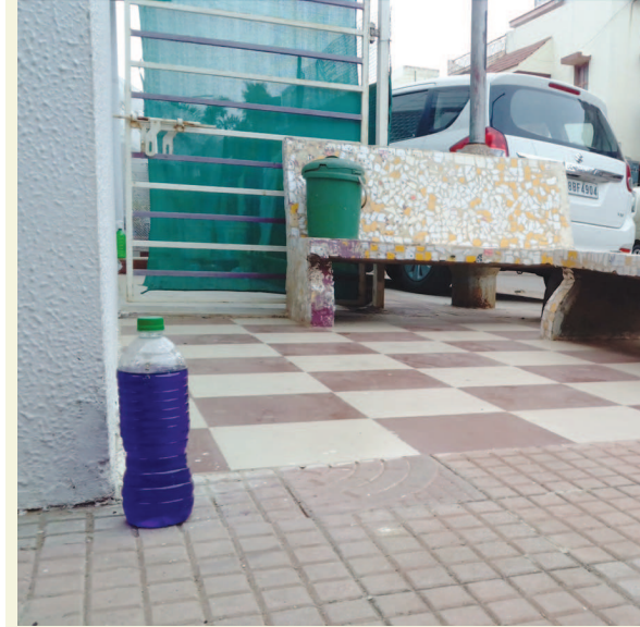
ગાંધીનગરમાં લગભગ દરેક સેક્ટરમાં રહીશો રખડતા ફૂતરાંઓથી ત્રાહીમામ છે. આ રખડતાં ફૂતરાં અચાનક જ પાછા પડે ત્યારે બાળકો અને વડીલોની હાલત કફોડી તેમજ દયનીય બની જાય છે ત્યારે રહીશો દ્વારા એક નવો તુકો અજમાવવામાં આવ્યો છે. ઘરના આંગણાની બહાર પ્લાસ્ટિકની બોટલમાં ગળી વાળું પાણી ભરી મૂકવામાં આવી રહ્યું છે જેથી ફૂતરાંઓ નજીક ના આવે અને તેમને ત્રાસ ઓછો થાય. આ તુકો કેટલો કારગત નીવડે છે એ તો ખબર નથી પરંતુ સેક્ટરોમાં ઘણી જગ્યાએ આવી પ્લાસ્ટિકની બોટલો જોવા મળે તો નવાઈ ન પામતા.

ગાંધીનગર, તા. ૧૨ રાજ્યમાં સતત ભેજવાળા વાતાવરણને પગલે સ્વાઈન ફ્લુ ક્યૂક ટેપા દેતા આરોગ્ય વિભાગ દોડતુ થઈ ગયું છે. ત્યારે ગાંધીનગર સિવિલ હોસ્પિટલમાં પણ સ્વાઈન ફ્લુના દર્દીઓ માટે ખાસ આઈસોલેશન વોર્ડ ઉભો કરાયો છે અને તે માટે ડોક્ટર, નર્સ તેમજ વર્ગ-૪ ના કર્મચારીઓ સહિતનો સ્ટાફ તેનાત કરી દેવાયો છે. જ્યારે સેક્ટર-૬ ખાતે ચિકનગુનિયાનો એક દર્દી સામે આવતા તંત્ર હરકતમાં આવી ગયું છે. સિવિલમાં એક અઠવાડિયામાં મેલેરિયાના ૩૧ અને ડેન્ગ્યુના ૧૭ કેસ નોંધાયો છે. ગાંધીનગર શહેર-જિલ્લામાં રોગચાળો બેકાબુ બની રહ્યો હોય તેમ લાગી રહ્યું છે. રોગચાળાને નાથવા માટે આરોગ્ય વિભાગ જોરશોરથી કામગીરી કરી રહ્યું છે. શહેરી વિસ્તારમાં મેલેરિયા, ટાઈફોઈડ અને ડેન્ગ્યુના કેસ સામે આવતા તંત્રએ કમરકસી છે. મેલેરિયાની ટીમ ડોર-ટુ-ડોર સર્વેલન્સની કામગીરી કરી રહી છે. ત્યારે ગાંધીનગરને અડીને આવેલા અન્ય જિલ્લામાંથી સારવાર માટે આવેલ પુરુષનો સ્વાઈન ફ્લુનો રીપોર્ટ પોઝીટીવ આવતા તંત્ર દોડતુ થઈ ગયું છે. એચનએનવન વોઈરસ હોસ્પિટલમાં અન્ય દર્દીઓમાં ન ફેલાય તે માટે સ્વાઈન ફ્લુના દર્દીને અલગથી સારવાર આપવાની આરોગ્ય તંત્રએ તાકીદ કરી હતી. જેથી સિવિલ તંત્રએ સ્વાઈન ફ્લુના દર્દી માટે તાત્કાલીક ડી-૩ આઈસોલેશન વોર્ડ ઉભો કરાયો છે જેમાં ડોક્ટર્સ, નર્સિંગ સ્ટાફ સહિત વર્ગ-૪ ના કર્મચારીઓ સહિતનો સ્ટાફ ગોઠવી દેવાયો છે. ત્યારે છેલ્લા એક સપ્તાહમાં ગાંધીનગર સિવિલમાં મેલેરિયાના-૩૨, ડેન્ગ્યુના-૧૭, સાઈટાના-૧૨૪, કમળાના-૫, ટાઈફોઈડના-૧૮ અને ડાડા-ઉલ્ટીના-૧૭૧ કેસ નોંધવા પામ્યા છે.