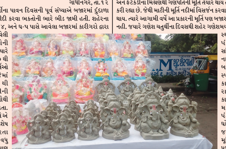
માટે લાલ કપડું, ખેસ, મુગટ, તોરણ, હાર સહિતના વધારાના શણગાર માટે રૂ. ૫૦ થી લઈને ૧૫૦ સુધી ખર્ચ કરતા હતા. જ્યારે વિઘ્નહર્તા ગણેશજીના આગમનથી શહેરમાં પણ અનોખું ભક્તિમય વાતાવરણ જોવા મળશે. જ્યારે તંત્રના નિયમોની એસી તેસી કરીને કેટલાક વેપારીઓએ પીઓપીની મૂર્તિનું પણ વેચાણ કર્યું હતું.