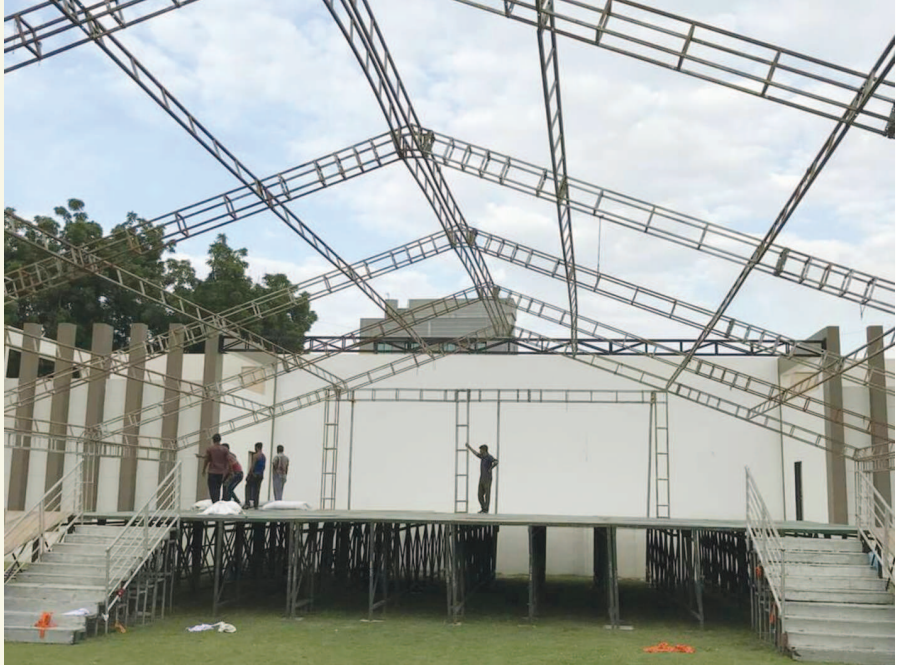
સે-૫-બીમાં શોપીંગ સેન્ટર ખાતે આયોજિત ગણેશ મહોત્સવમાં આનંદનો ગરબો, શિવ મહિમા, નાટક, ભજન, સુંદરકાંડ, સત્યનારાયણ કથા,