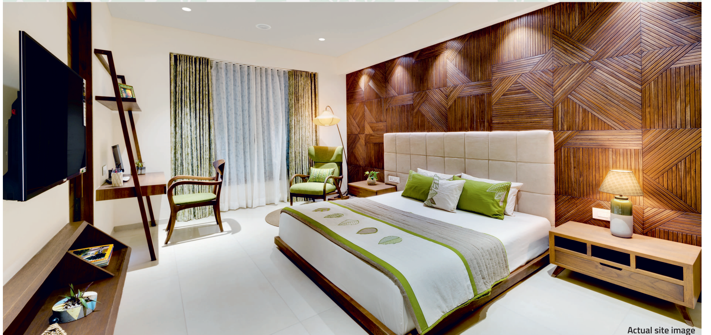
Actual site image