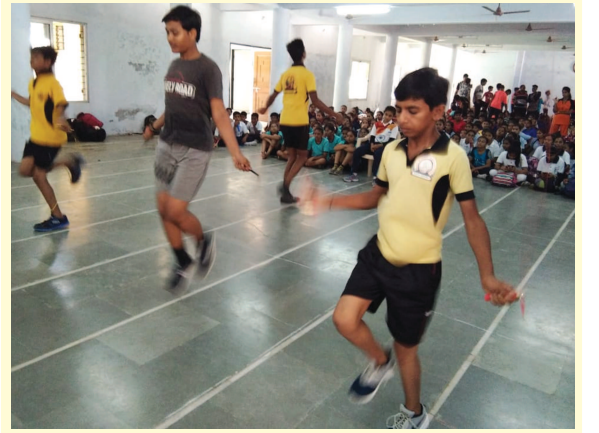
કમિશ્નર શ્રી યુવક સેવા અને સાંસ્કૃતિક પ્રવૃત્તિ, ગાંધીનગર તેમજ જિલ્લા રમતગમત અધિકારીની કચેરી ગાંધીનગરના સંયુક્ત ઉપક્રમે રાજ્યકક્ષાની જન્મ રોપ સ્પર્ધા પી આર ઠક્કર વિદ્યાવિહાર, મગોડીમાં યોજાઈ હતી, જેમાં સમગ્ર રાજ્યમાંથી કુલ ૮૦ ટીમોએ ભાગ લીધો હતો.