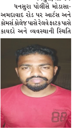
જળવાઈ રહે તે માટે વાહનોનું સઘન ચેકીંગ હાથ ધરતા પસાર થતી શંકાસ્પદ ઈન્ડિગો કારને અટકાવી તલાશી લેતા કારમાંથી ૩૦૦ કિલો

ધનસુરા, તા. ૨૧ ધનસુરા પોલીસે મોડાસા-અમદાવાદ રોડ પર આટલસ અને કોમર્સ કોલેજ પાસે રેલવે ફાટક પાસે કાયદો અને વ્યવસ્થાની રિથિતિ