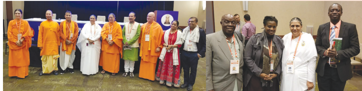
ઉપરાષ્ટ્રપતિ વેન્કેશ નાયડુ પહોંચ્યા શિકાગોમાં આયોજિત દ્વિતિય વિશ્વ હિન્દુ કોંગ્રેસમાં

સ્વાઈનફલુ જણાતા મહિલાના લોહીના પરીક્ષણ લેબોરેટરી કરાવતા મહિલાનો રિપોર્ટ એચ ૧ એન ૧ પોઝીટિવ આવતા પરિવારજનોને જાણ કરતા પરિવારજનો ફફળી ઉઠ્યા હતા. અમદાવાદની ખાનગી હોસ્પિટલ દ્વારા જિલ્લા આરોગ્ય વિભાગને જાણ કરતા જિલ્લા આરોગ્ય વિભાગ દ્વારા ઈકારી ગામે મહિલાના પરિવારજનો અને ગામલોકોની આરોગ્ય ચકાસણી હાથ ધરી હતી. જિલ્લામાં અત્યાર સુધી ૫ દર્દીઓ સ્વાઈનફલુના નોંધાયા હોવાની સાથે ધનસુરા તાલુકાની ૨ વર્ષીય બાળકી સ્વાઈનફલુથી મોત નિપજાતા જિલ્લા વાસીઓ ફફળી ઉઠ્યા છે.