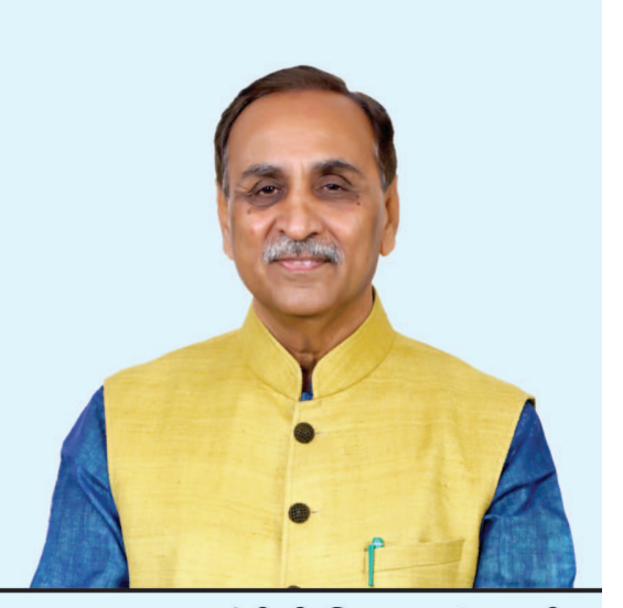
માન. વડાપ્રધાનશ્રી નરેન્દ્રભાઈ મોદી ભારત