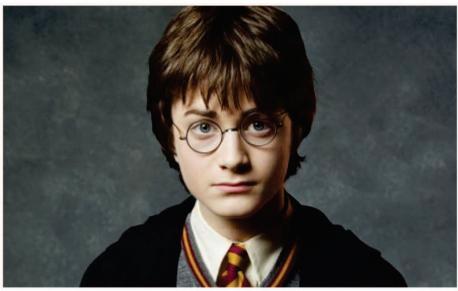
ડેનિયલ રેડક્લિફ (હેરી પોટ્ટર ફ્રેમ) Dyspraxia

લર્નિંગ ડિસેએબિલીટી ધરાવતી વિશ્વ પ્રસિદ્ધ હસ્તીઓ અને તેમની સિદ્ધિઓ