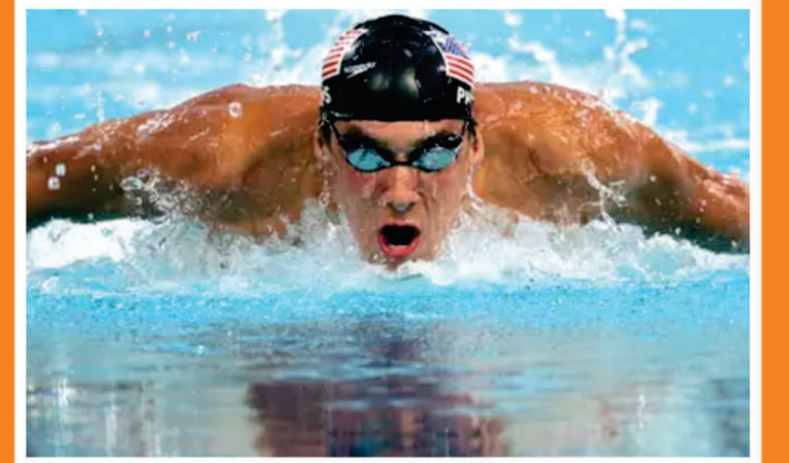
માઈકલ ફેલ્પ્સ - (પ્રસિદ્ધ સ્વીમર) ADHD

આ વિષય પર સમાજ ધ્યાન આપે તે ઉદ્દેશ્યથી આવતી કાલે એક હાફ મેરથોનનું આયોજન કરવામાં આવેલ છે. જેને એશિયન ગેમ્સમાં ગોલ્ડ મેડલ જીતનાર ગુજરાતની ગોલ્ડન ગર્લ સરિતા ગાયકવાડ ફ્લેગ ઓફ કરશે.