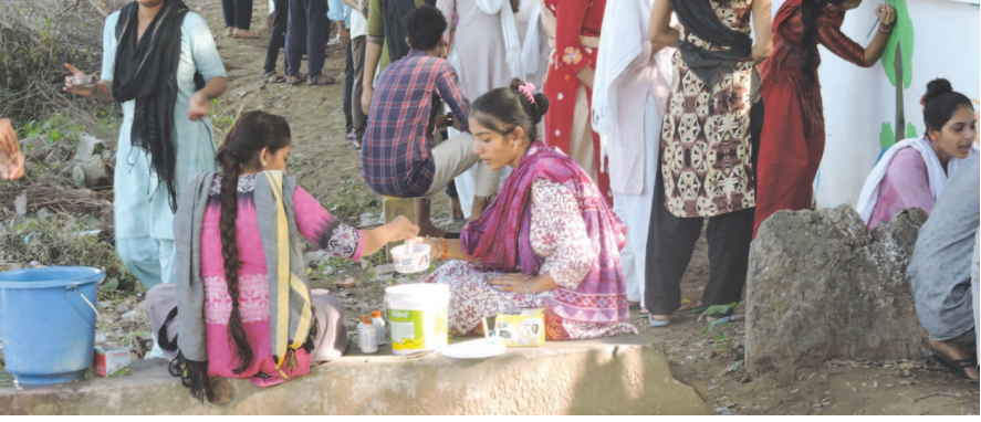
રાંધેજ ખાતે વિદ્યાપીઠના વિદ્યાર્થીઓનું વોલ પેઈન્ટિંગ

કમિશનર ગ્રામ વિકાસની કચેરી, ગાંધીનગરમાં કચેરીમાં યોજાતી મીટીંગમાં ઉપસ્થિત કર્મચારીઓ / અધિકારીઓને માટે રીકેશનમેન્ટ માટેની વ્યવસ્થા (યા, નાસ્તો, બોજન તથા પાણીની વ્યવસ્થા) અંગેના ભાવો મેળવવાના થાય છે. તે માટે રસ ધરાવતી સ્થાનિક એજન્સીઓએ જાહેરાત પ્રસિદ્ધ થયેથી તા. ૫/૧૦/૨૦૧૮ના રોજ, ૧૬.૦૦ કલાક સુધીમાં જાહેરાત રજાના દિવસે સિવાય કમિશનર ગ્રામ વિકાસની કચેરી, બ્લોક : ૧૬/૩, ડો. જીવરાજ મહેતા ભવન, ગાંધીનગરની હિસાબી શાખામાં રૂ. ૧૦૦/- ભરી ટેન્ડર ફોર્મ લઈવાટી શાખામાંથી મેળવી શકાય. નિયત નમુનાનું ટેન્ડર ફોર્મ સીલબંધ કરવડાં તા. ૧૧-૧૦-૨૦૧૮ના રોજ ૧૬.૦૦ કલાક સુધીમાં ભળી રહે તે રીતે રજીસ્ટર પોસ્ટ એ. ડી. કે સ્પીડ પોસ્ટથી મોકલવાના રહેશે. સહી/- નાસાણ કમિશનર ગ્રામ વિકાસ-ગુજરાત રાજ્ય ગાંધીનગર