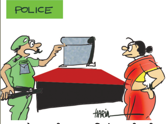
હાલેન તમારી તમારા પતિનાં ત્રાસની ફરીયાદ અત્યારે નોંધી નહીં શકાય... અમારા સાહેબ પણ તેના સાહેબનાં ત્રાસથી હાજર નથી...