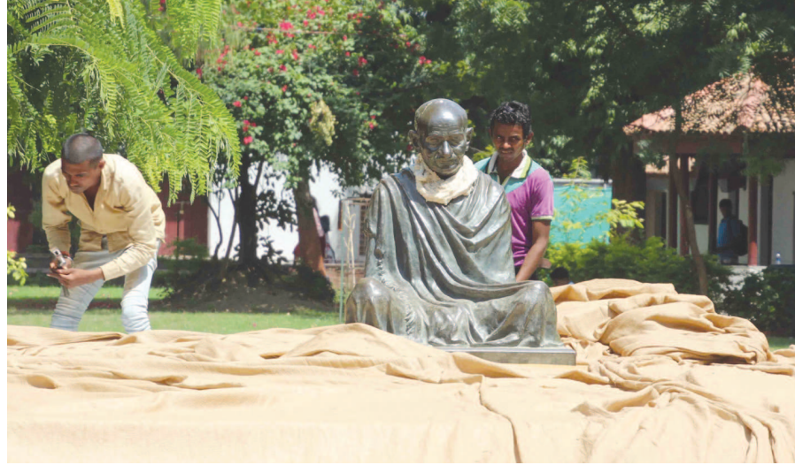
ગાંધી ૧૫૦ : રાષ્ટ્રપિતા મહાત્મા ગાંધીની ૧૫૦મી જન્મજયંતિની ઉજવણી માટે દેશભરમાં તડામાર તૈયારીઓ ચાલી રહી છે. ગાંધીજીના નિવાસસ્થાન સમા સાબરમતી આશ્રમ ખાતે પણ ગાંધી જયંતિની ઉજવણી ભાવપૂર્વક કરાશે.