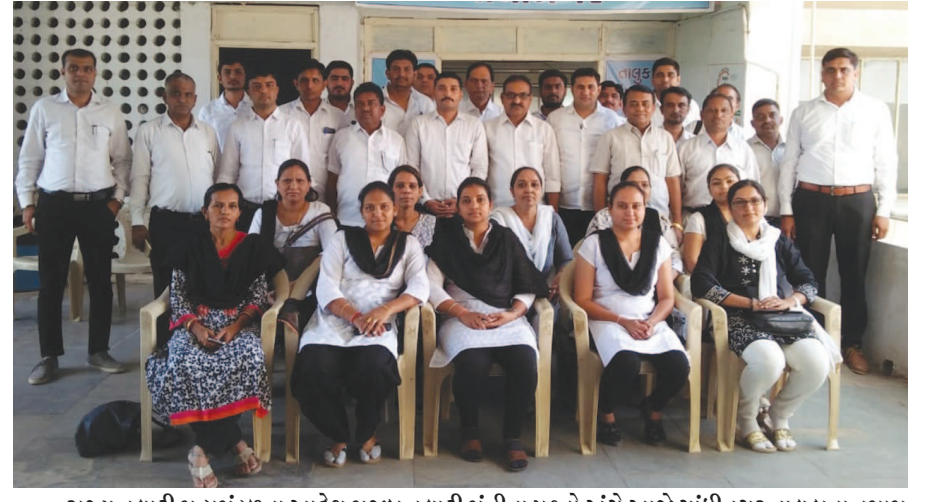
રાજ્ય તલાટી મહામંડળના આદેશ મુજબ તલાટી મંત્રીના પ્રશ્નો અંગે આજે ગાંધીનગર તાલુકાના તમામ તલાટી મંત્રીઓ સામુહિક સી.એલ. પર ઉતર્યા હતા.

ગાંધીનગરમાં તા. ૩૦મી સપ્ટેમ્બર રવિવારે સવારે ૭.૩૦ કલાકે વર્લ્ડ વોકિંગ ડે નિમિત્તે વોકનું આયોજન કરવામાં આવ્યું છે. આ આયોજન જર્મનીની એસોસિએશન ફોર ઈન્ટરનેશનલ સ્પોર્ટ્સ ફોર ઓલ-રફીસા સંસ્થા દ્વારા યુનો અને યુનેસ્કોના સહયોગથી ગુજરાતની સ્પોર્ટ્સ ફોર ઓલ એક્મ દ્વારા કરવામાં આવ્યું છે. આ વોકનો પ્રારંભ કોબા માર્ગ પર કુડાસણ ખાતેના ગુજરાત ગારમેન્ટ ઝોન ખાતેથી કરવામાં આવશે જે સ્વામિનારાયણ મંદિર પાસે સમાપન પામશે. વિશ્વભરમાં શારીરિક નિષ્ક્રિયતા વધી રહી છે જેના કારણે મેદસ્વિતા સહિત ડાયાબીટીશ, હૃદયરોગ, ડાયાબીટીસ, ઓબેસિટી અને ડિપ્રેશન જેવા અન્ય રોગોનો ઉત્તેજન ઉત્તમ કસરત ગણાય છે અને ચાલવા થકી સ્વાસ્થ્ય અંગે જાગૃતિ ફેલાવવાના આશયથી ટીસા દ્વારા વોકનું આયોજન કરવામાં આવ્યું છે. આ વોકમાં ભાગ લેનારા પ્રથમ ૨૦૦ વોકર્સને સંસ્થા દ્વારા શુભેચ્છા ટી-શર્ટ ભેટ અપાશે. વોક દરમિયાન વોકર્સ માટે ચા-નાસ્તા-પાણીની સુવિધા કરવામાં આવી છે.