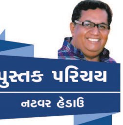
પુસ્તક પરિચય નવર હેડાઈ