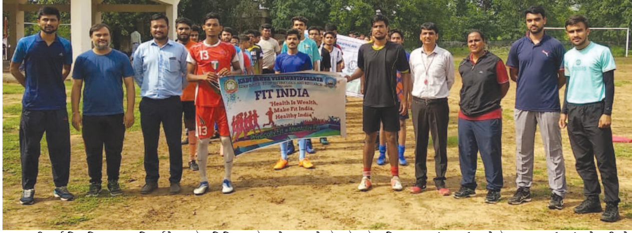
કડી સર્વ વિશ્વવિદ્યાલયના ડિપાર્ટમેન્ટ ઓફ ફિઝિકલ એજ્યુકેશન અને એનએસએસ વિભાગના સંયુક્ત ઉપક્રમે નેશનલ સ્પોર્ટ્સ ડે પ્રસંગે ફિટ ઈન્ડિયા મૂવમેન્ટ યોજવામાં આવી હતી. અશ્વિનભાઈ એ પટેલ કોમર્સ કોલેજના એનએસએસ યુનિટ, એલડીઆરપી ઈન્સ્ટીટ્યુટ કોલેજના એનએસએસ યુનિટ, એમ એમ પટેલ સાયન્સ કોલેજના એનએસએસ યુનિટના સ્વયંસેવકો

ગાંધીનગર, તા. ૩ બેન્ક ઓફ ઈન્ડિયાના સ્થાપના દિવસની ઉજવણી દેશનાં વિવિધ શહેરોની માફક ગાંધીનગર ખાતે પણ કરવામાં આવી રહી છે. આ નિમિત્તે વિવિધ કાર્યક્રમોનું આયોજન કરવામાં આવ્યું છે. તા. ૩૦ સપ્ટેમ્બરના રોજ સર્વ વિદ્યાલય કેળવણી મંડળ સંચાલિત એસ જી ઈન્વિલ્ડ મીડિયમ પ્રાઈમરી સ્કૂલ ખાતે ચિત્રસ્પર્ધાનું આયોજન કરવામાં આવ્યું હતું, જેમાં ૧૩૦ જેટલા વિદ્યાર્થીઓએ ભાગ લીધો હતો. તા. ૪થીના રોજ સાંજે ચાર કલાકે બેન્ક ઓફ ઈન્ડિયા, ગાંધીનગર ખાતે કસ્ટમર મીટિંગનું આયોજન કરવામાં આવ્યું છે. પાંચમી સપ્ટેમ્બરે સવારે ૯થી બપોરના કલાક દરમિયાન બેન્ક ખાતે ફ્રી મેડિકલ કેમ્પનું આયોજન કરવામાં આવ્યું છે. બ્લડપ્રેશર, આંખો અને બ્લડ-શુગરની તપાસ આ કેમ્પ અંતર્ગત કરવામાં આવશે.