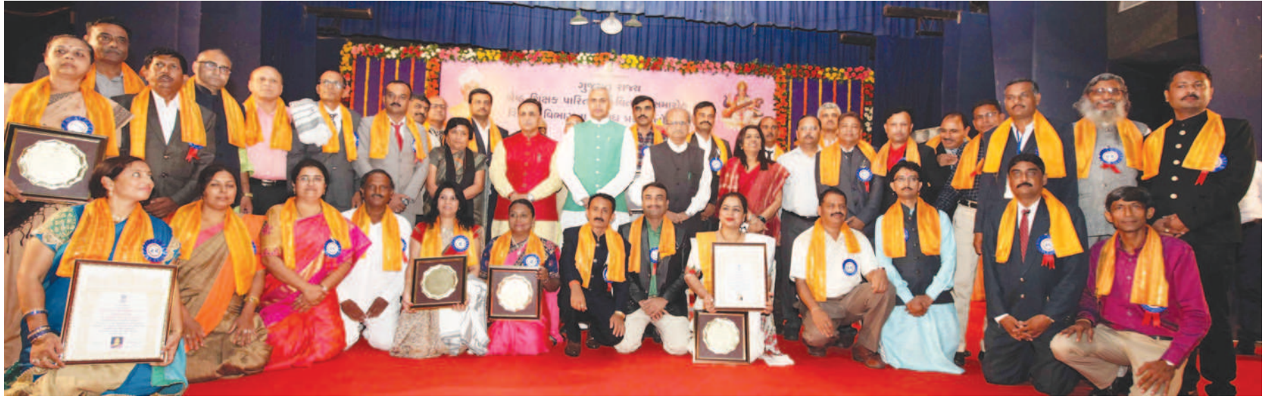
તેમણે શિક્ષક સમાજના શક્તિ, સામર્થ્યથી ભારત માતાને દુર્ગા જેવી શક્તિશાળી અને આહવાન પણ શિક્ષકોને કર્યું હતું. શિક્ષણમંત્રી ભૂપેન્દ્રસિંહ શિક્ષક અને પૂર્વ રાષ્ટ્રપતિ ડૉ. સર્વપલ્લી રાધાકૃષ્ણનના જન્મદિવસને ભારત સહિત નોબલ પ્રાઈઝ માટે નોમિનેટ કરાયું હતું. જે એક શિક્ષક માટે ગૌરવશાળી બાબત ગણી શકાય છે. જેના ભાગરૂપે આ વર્ષે ૨૭ ઓક્ટોબરે ગાંધીજીની ૧૫૦મી જન્મજયંતી ઉજવાઈ રહી છે.

આ પ્રસંગે ગત વર્ષે ધોરણ પ થી ૭ની સગ્રાંત અને વાર્ષિક પરીક્ષામાં ગુજરાતી, ગણિત અને અભ્યાસમાં અતિ તેજસ્વી ડૉ. સર્વપલ્લી રાધાકૃષ્ણનને સન્માનિત કરવામાં આવ્યું હતું.