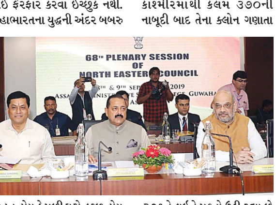
કોઈ ફેરફાર કરવા ઈચ્છુક નથી. મહાભારતના યુદ્ધની અંદર બબરુ કાશ્મીરમાંથી કલમ ૩૭૦ની નાબૂદી બાદ તેના કલોન ગણાતા દિવસે અમલી કરવાનો નિર્ણય કરવામાં આવ્યો હતો.

ગુવાહાટી, તા. ૮ આસામમાં રાષ્ટ્રીય નાગરિકતા રજિસ્ટર (એનઆરસી) માટે કાર્યવાહી યોજાઈ રહ્યામાં આવ્યા બાદ કેન્દ્રીય ગૃહમંત્રી અમિત શાહે આજે પ્રથમ વખત રાજ્યમાં પહોંચ્યા હતા. નોર્થઈસ્ટ કાઉન્સિલની બેઠકમાં ભાગ લેવા માટે પહોંચેલા અમિત શાહે કહ્યું હતું કે, પૂર્વોત્તરને ખાસ દરજ્જા આપનાર કલમ ૩૭૧ સાથે કોઈ ચેડા કરવામાં આવનાર છે. પૂર્વોત્તરને મળેલા ખાસ દરજ્જામાં ફેરફારની કોઈ યોજના નથી. ભાજપ સરકાર આ ખાસ દરજ્જાનું સન્માન કરે છે. અમિત શાહે કહ્યું હતું કે, ભાજપ સરકાર પૂર્વોત્તરના રાજ્યોને જે સુધિ મળેલી છે તેમાં