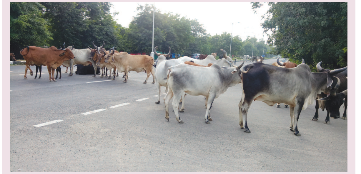
વિશ્વભરમાં માર્ગ અકસ્માતોમાં ભારત મોખરે છે જેને અનુલક્ષીને એક તરફ સરકાર દ્વારા માર્ગ અકસ્માતોની સંખ્યા ઘટાડવા ટ્રાફિકના નિયમોનો ભંગ કરનાર વાહનચાલકો પર અતિશય આકરા દંડની જોગવાઈઓનો દંડો ઉગામવામાં આવ્યો છે જે અંગે પ્રજામાં અસંતોષ સ્પષ્ટ જણાઈ રહ્યો છે, બીજી તરફ સમગ્ર સરકારી અને વહીવટીતંત્ર વાહનચાલકોના અધિકાર અને સુરક્ષા પુરી પાડવામાં સર્દતર નિષ્ફળ રહ્યું છે. સોશયલ મિડીયા પર નવી દંડનીય જોગવાઈઓ પ્રત્યે અવનવા ચબરાકિયાં થકી વિરોધ પ્રદર્શિત થઈ રહ્યો છે. તેમાં એક મજાક તો એવી પણ કરવામાં આવી રહી છે કે “સુઈવીંગ લાયસન્સ માટેના ટેસ્ટમાં વચ્ચે બે-ચાર હોર પણ ઉભા રાખવા જોઈએ કેમ કે વાહન સહીસલામત રીતે ચલાવવા એ યોગ્યતા જરૂરી છે” આ માત્ર એક જોક્ નથી પરંતુ દીવા જેવું સત્ય છે કે વહીવટીતંત્ર રખડતાં ઢોરને નિયંત્રણ કરવામાં તદ્દન નિષ્ફળ નિવડ્યું છે જે આ તસ્વીરમાં દેખાય છે. ગાંધીનગરના માર્ગ નં. ૧ પર સેક્ટર-૪ પાસે આખો રોડ બ્લોક કરીને ઉભેલી આ ગાયો માટે શું કોઈને દંડ થશે ખરો? અને, આવી તો પરિસ્થિતિ દરેક શહેરના લગભગ દરેક માર્ગની છે, શું સરકારે વાહન ખરીદતા ઉધારવેલા રોડ ટેક્સની સામે કોઈ “કરજ” નિભાવવાની જવાબદારી તંત્રની ખરી કે નહીં?

ગાંધીનગર, તા. ૮ ગાંધીનગર જિલ્લામાં આગામી દિવસોમાં કુપોષણ મુક્તિ અભિયાન અંતર્ગત પાસ “પોષણ મેળા”નું આયોજન કરવામાં આવનાર છે આ માટે તંત્રએ વિચારણા પણ હાથ ધરી દીધી છે. પ્રાપ્ત થતી વિગતો પ્રમાણે સપ્ટેમ્બર માસ પોષણ માસ તરીકે ઉજવાઈ રહ્યો છે ત્યારે ભારત સરકારે કુપોષણ મુક્તિ અભિયાન એક જનઆંદોલન બને તે માટે વિવિધ પ્રકારના કાર્યક્રમોના આયોજન અંગે માર્ગદર્શન આપી “પોષણ ભાગીદારી અને પોષણ પર ચર્ચા” જેવા વિષયો સામેલ કરી કુપોષણ મુક્તિ અભિયાનને સઘન બનાવવા પર ભાર મુક્યો છે. ભારત સરકારે જિલ્લા તેમજ મહાનગરોના કાર્યક્રમ માટે અલગ અલગ કાર્યક્રમો પણ સુચવ્યા છે. મહિલા અને બાળ વિકાસ વિભાગને નોડલ વિભાગ ધોષિત કરી તમામ વિભાગોને સંકલનમાં રહી કેવા કાર્યક્રમો યોજવા તે વિશે પણ સુચવ્યું છે. મળતી વિગતો પ્રમાણે આગામી દિવસોમાં જિલ્લામાં પોષણ મેળાના આયોજન અંગે આરોગ્ય, શિક્ષણ અને મહિલા બાળ વિકાસ વિભાગ સંકલનમાં રહી આયોજન તૈયાર કરે તેવી સૂચનાઓ જિલ્લાતંત્ર દ્વારા આપવામાં આવી છે. ૧૫મી સપ્ટેમ્બર પછી આ નવતર મેળાનું આયોજન થશે તેમ તંત્રના સૂત્રોમાંથી પ્રાપ્ત થાય છે. જિલ્લામાં હાલ ચાર હજારથી વધુ બાળકો કુપોષણ કેટેગરીમાં આવે છે. જિલ્લા આરોગ્યતંત્ર તેમજ અન્ય વિભાગો દ્વારા કેવા કાર્યક્રમો યોજવા તે માટે વિભાગે એક વિસ્તૃત પત્ર પણ પાઠવ્યો છે. ભાદરવી પૂનમના મહામેળા પછી આ નવતર મેળાનું આયોજન કરવામાં આવશે.