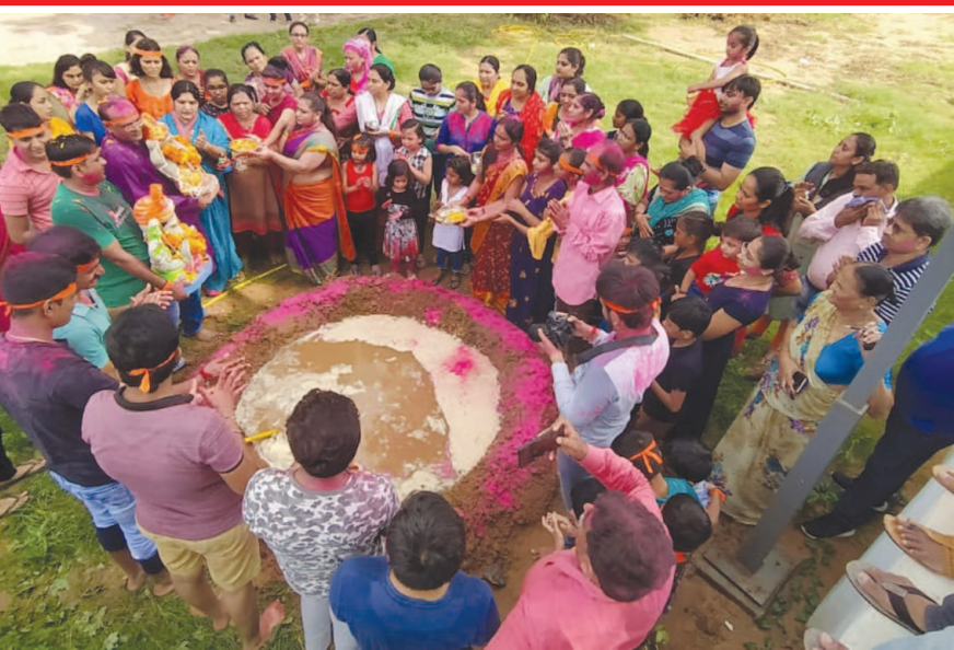
પ્રમુખ એલીગન્સ સોસાયટી કુડાસણની સોસાયટી સમિતિ દ્વારા સોસાયટીના કમ્પાઉન્ડમાં પાણીનો વધુ બગાડ ન થાય તે રીતે તમામ રહીશોના સાથ સહકાર દ્વારા ગણેશ વિસર્જન કરવામાં આવ્યું હતું.

મુખ્યમંત્રીએ કરેલી મહત્વની જાહેરાતો તા. ૧૬મી સપ્ટેમ્બરથી નવા મોટરવાહન અધિનિયમનો કડક અમલ લાયસન્સ સહિતના દસ્તાવેજો ડિજિટલ લોકરમાં સેવ હશે તો માન્ય હેલ્મેટ વગર પ્રથમવાર રૂ. ૫૦૦, બીજીવાર રૂ. ૧૦૦૦ સીટબેલ્ટ વગર પ્રથમવાર રૂ. ૫૦૦ સ્કૂટરમાં ત્રણ સવારી રૂ. ૫૦૦ લાયસન્સ, વીમો, પીયુસી કે આરસીબુક ન હોય તો રૂ. ૫૦૦, રૂ. ૧૦૦૦ અડચણરૂપ પાર્કિંગ માટે રૂ. ૫૦૦ અને રૂ. ૧૦૦૦ કાચ પર ડાર્ક ફિલ્મ માટે રૂ. ૫૦૦ અને રૂ. ૧૦૦૦ ચાલુ વાહને મોબાઈલ પર વાત રૂ. ૫૦૦ અને રૂ. ૧૦૦૦ રોંગસાઈડ, ઓવર સ્પીડ અને ભયજનક વાહન હંકારવા માટે પ્રી વ્હીલર સુધી રૂ. ૧૫૦૦, એલએમવી રૂ. ૩૦૦૦ અને ભારે વાહનોને રૂ. ૫,૦૦૦નો દંડ ડ્રાઈવિંગ લાયસન્સ ન હોય તો રૂ. ૫૦૦ અને રૂ. ૩૦૦૦ રજિસ્ટ્રેશન વગરના વાહન માટે રૂ. ૫૦૦, શ્રી વ્હીલરને રૂ. ૨૦૦૦ અને ફોર વ્હીલરને રૂ. ૫,૦૦૦ ફીટનેસ વગરનું વાહન ચલાવનારને શ્રી વ્હીલરને રૂ. ૫૦૦ અને ફોર વ્હીલરને રૂ. ૧૦૦૦ પીયુસી વગરનું વાહન રૂ. ૫૦૦ અને અન્ય વાહનોને રૂ. ૩૦૦૦ અવાજનું પ્રદૂષણ કરતા વાહનોને રૂ. ૧૦૦૦ ખેતીનો માલ અને ઘરવખરી લઈ જતા વાહનોને રૂ. ૧૦૦૦ એમ્બ્યુલન્સ-ફાયરબ્રિગેડ વગેરેને સાર્થક ના આપવાથી રૂ. ૧૦૦૦ જાહેરમાં રેસ કરનારને પ્રથમવાર રૂ. ૫૦૦૦ અને પછી ૧૦૦૦૦