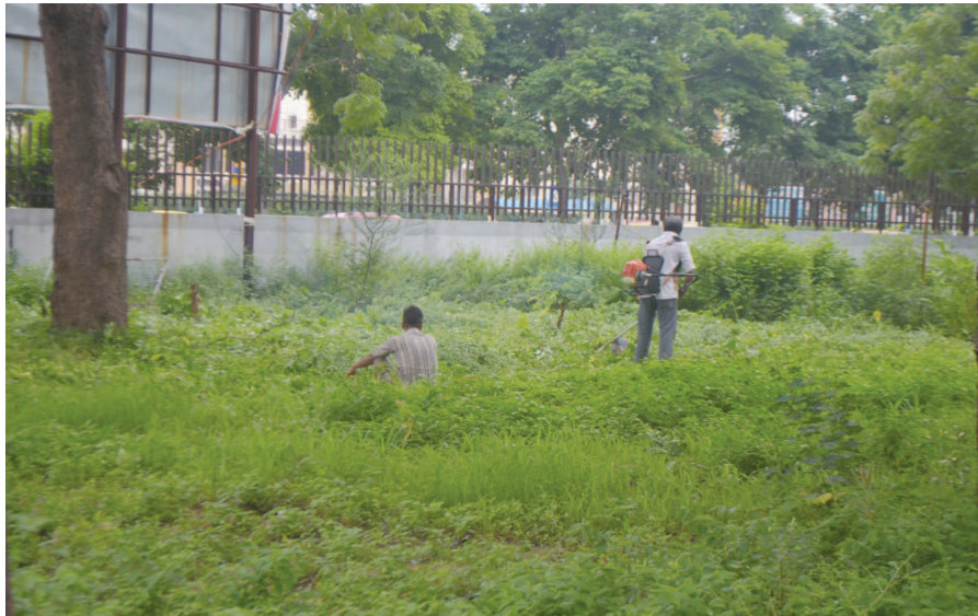
વરસાદી માહોલના પગલે ચોતરફ અનેક પ્રકારની વનસ્પતિ અને ઘાસ વેલાં વગેરે ઉગી નીકળ્યા છે. બગીચાઓનું શહેર કહેવાતા ગાંધીનગરની સિવિલ હોસ્પિટલ સંકુલમાં વિકસાવાયેલ બગીચામાં પણ કુદરતી રીતે ઉગી નિકળેલી વનસ્પતિના કારણે બગીચાનું સૌંદર્ય ઝંબવાય નહી તે હેતુથી કમ્પ્યારીઓ દ્વારા આવી બિનજરૂરી અને બિનઉપયોગી વનસ્પતિનું કટિંગ કરી દવા છંટકાવ કરવામાં આવી હતી.