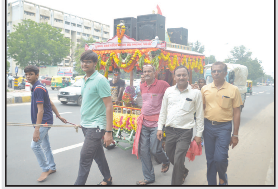
શહેરના માર્ગો પર અંબાજીના પદયાત્રીઓનો પ્રવાહ માંડ શમ્યો છે ત્યાં અમદાવાદથી કુકરવાડા ખાતે ચાલતા માતાજીના દર્શનાર્થે જતા પદયાત્રીઓને નિહાળી નગરજનો અચંચિત થયા હતા. કુકરવાડા ખાતેના અંબાજી માતાને કુળદેવી માનતા આ શ્રદ્ધાળુ માઈબક્તો માતાજીના રથ સાથે ડીજેના તાલે ભક્તિ સંગીત વગાડતા આનંદપૂર્વક જુસ્સાથી ચાલતા હતા.