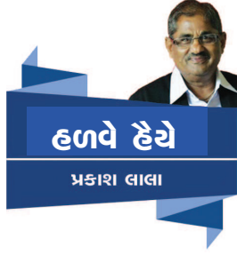
હળવે હેણે પ્રકાશ લાલા

નવરાત્રિ... અંકલના પ્રશ્નના જવાબમાં અમે અમારું લાંબુલચ્ચ કહાપણ કોહણ્યું. 'તો તમને એ પણ ખબર છે જ કે નવરાત્રિ દરમિયાન ઘણા બધા નવરાત્રિ મહોત્સવો મોટાપાણે ઊજવાય છે?' 'હા... જેમ કે ગાંધીનગર કલ્ચરલ ફોરમ છેલ્લા ૨૪ વર્ષથી સાતત્યપૂર્ણરિતે, આયોજનબદ્ધ ભવ્યાતિભવ્ય નવરાત્રિ મહોત્સવો ઊજવીને રાજ્યભરમાં ડંકો વગાડ્યો છે ને આ વર્ષે તો - પરચીસમા રજતજયંતિ વર્ષે ગાંધીનગર કલ્ચરલ ફોરમ એથીય વધુ પ્રસાદાત્મક નવરાત્રિ મહોત્સવ - ૨૦૧૯ ઊજવાવાનું છે, હોં !' પાછું અમે અમારું જ્ઞાન પીરસ્થું. 'આમ એટલે ?' 'હા... આ મારી મોકાણ મંડાલી છે...'