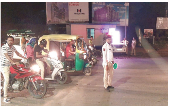
ગાંધીનગર જિલ્લા પોલીસવડાના માર્ગદર્શન હેઠળ ટ્રાફિક પોલીસ દ્વારા ટ્રાફિકના નિયમો અંગે નગરજનોમાં જાગૃતિ આવે તે માટે પ્રયાસ હાથ ધરાયા હતા. નગરના માર્ગો પર એલઈડી સ્ક્રીન અને માર્કેટ દ્વારા નિયમો અંગે શહેરીજનોને જાણકારી અપાઈ હતી.