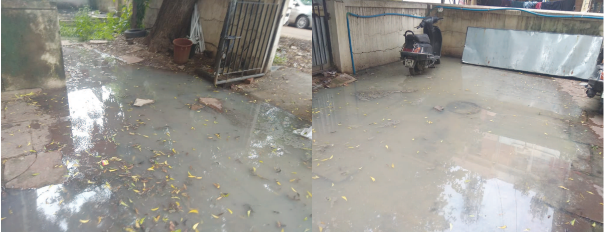
ગાંધીનગર શહેરમાં સેક્ટર-૧૬ પાટનગર યોજના ભવન અને બેંક વિસ્તારમાં છેલ્લા ઘણા સમયથી ગટર ઉભરાવાની વ્યાપક પ્રમાણમાં ફરિયાદો ઉઠવા પામી છે. છેલ્લા ત્રણ દિવસથી ઈન્ડિયન ઓવરસીઝ બેન્ક પાછળ આવેલી ગટર ઉભરાતા ગટરનું ગંદુ પાણી બેંકના ભોયરામાં ફરી વળ્યું હતું. છેલ્લા ત્રણ દિવસથી વાણિજ્ય વિસ્તારના વેપારીઓ અને બેંક અધિકારીઓએ તંત્રને જાણ કરવા છતાં કોઈ નિરાકરણ આવેલ નથી ગટર ઉભરાતા નગરજનો રોગચાળાનો ભય અનુભવી રહ્યા છે.