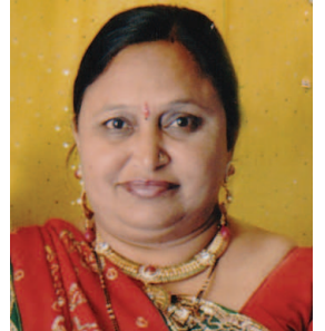
લાલપાના શુક્લ લાયોનેસ ક્લબ