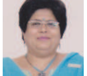
પ્રિયા માનિક લાયોનેસ ક્લબ